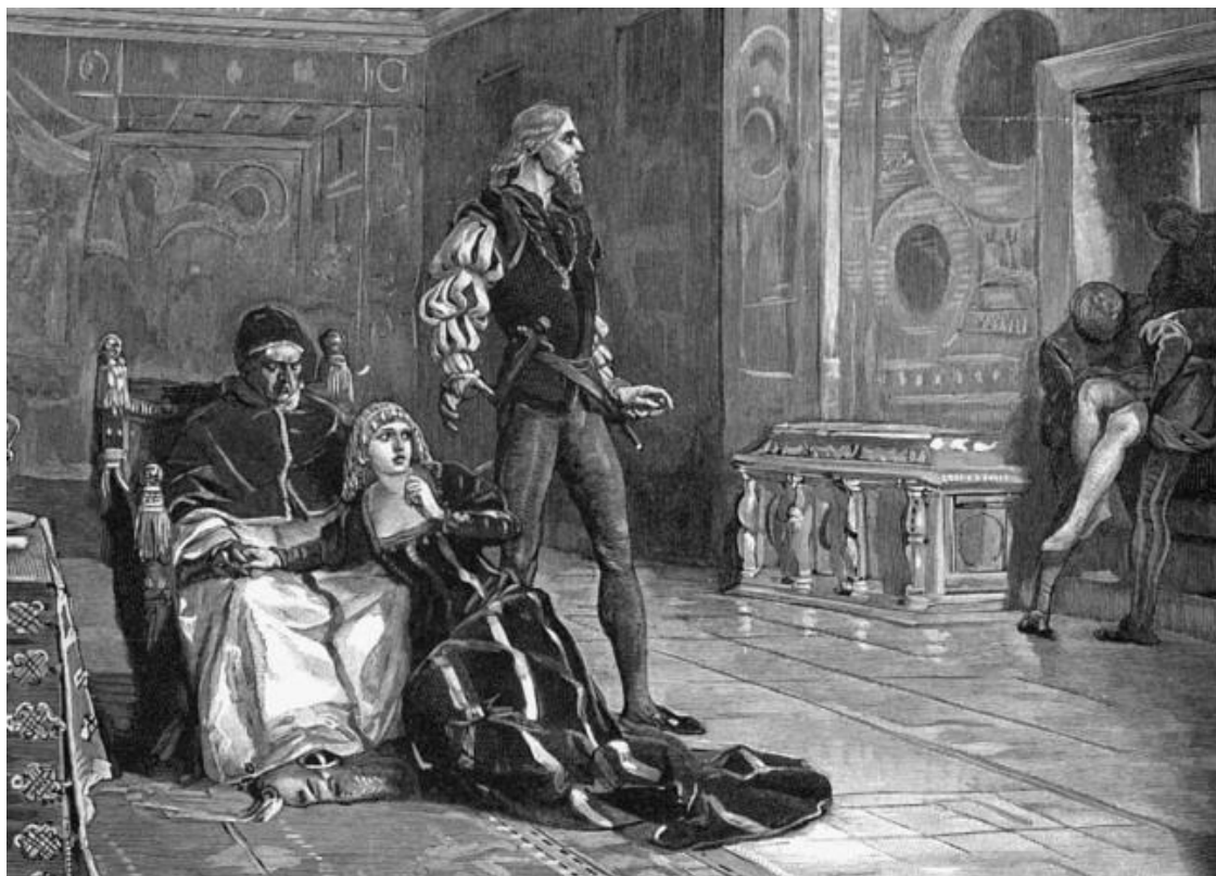
Папа Александр VI, Лукреция и Чезаре Борджиа видят найденное в Тибре тело Джованни. Гравюра XIX в.

Сидевший на коне приблизился и спросил, пошёл ли труп ко дну; они ему ответили: “Да, сеньор”. Тогда сидевший на коне посмотрел на реку, увидел плавающую в реке мантилью трупа и спросил пеших, что это чёрное, плавающее на реке. Они ответили: “Мантилья”; один из них бросил камни, чтобы мантилья погрузилась в глубину. После погружения мантильи все пятеро удалились, – два других пеших, которые вышли из второй улочки, высматривая, не проходил ли кто, присоединились к всаднику и к двум другим и пошли по другому переулку, который дает подход к странноприимному дому св. Якова, – и больше они не появлялись».