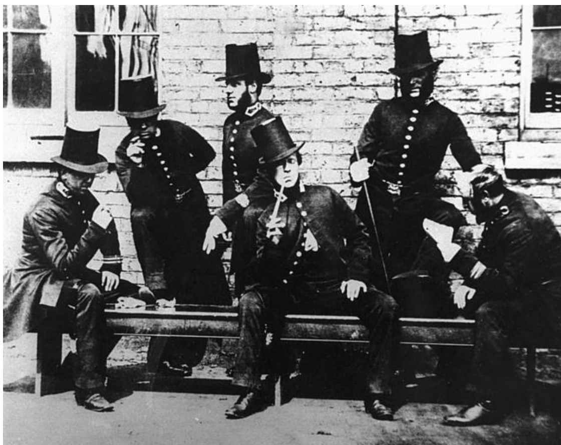
Лондонские полицейские XIX в.

Еще одним органом правопорядка в конце XVII века была «Марширующая стража», патрулировавшая улицы. В 1705 году «чарли» и уличных обходчиков объединили, при этом журналисты впоследствии потешались над традицией нанимать себе сменщиков: «Требуются сто тысяч человек для лондонских стражников. Не стоит претендовать на эту доходную должность, если вам не шестьдесят, семьдесят, восемьдесят или девяносто лет, если вы не слепы на один глаз и не видите плохо другим, если вы не хромы на одну или на обе ноги, если вы не глухи как столб, если астматический кашель не рвет вас на куски, если ваша скорость несравнима со скоростью улитки, а сила рук не мала настолько, что не позволяет арестовать даже старуху-прачку, возвращающуюся после тяжелого трудового дня у лохани для стирки» (сатирическое объявление 1821 года).