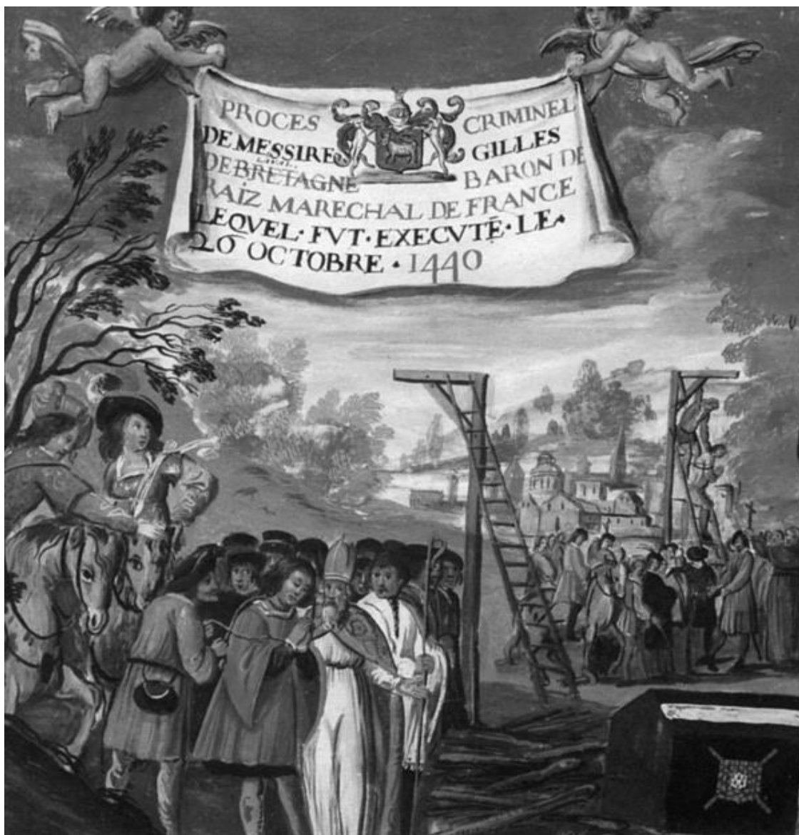
Казнь Жюль де Ре. Рисунок середины XVI в.

Действительно ли то было вмешательство Бога или просто дело случая, но в некоторых ситуациях ворота тюрьмы сами распахивались, веревки обрывались или же находилась сердобольная женщина, готовая взять осужденного в мужья. В общем, порой случались всякие неожиданности.