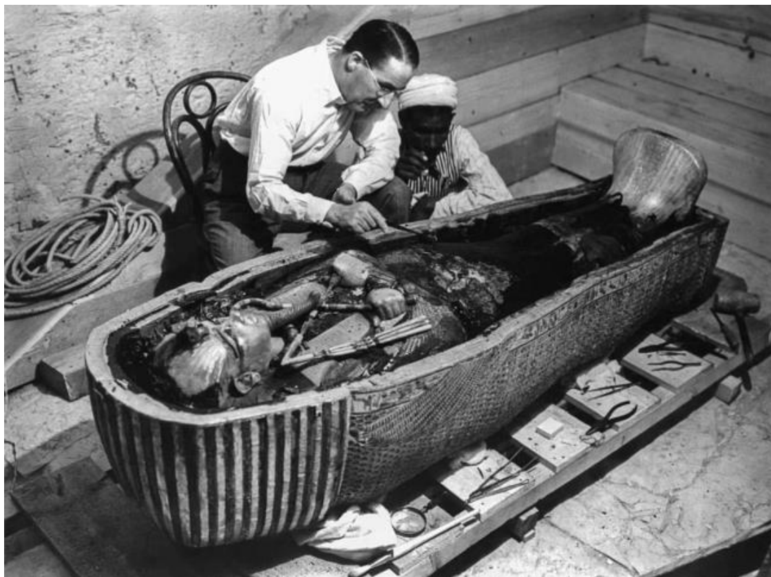
Картер изучает саркофаг Тутанхамона. Октябрь 1925 г.

Но в 1923 году лорд Карнарван умер, гробница была заброшена и никем не охранялась, поскольку человечество оказалось втянуто в кризисы, катаклизмы и войны. Каждый, случайно или намеренно попавший в эти края, мог легко поживиться археологическими находками, и усыпальница фараона стала жертвой черных копателей. В результате пропало даже то кольцо с бусинами, которое не удалось снять эксперту.