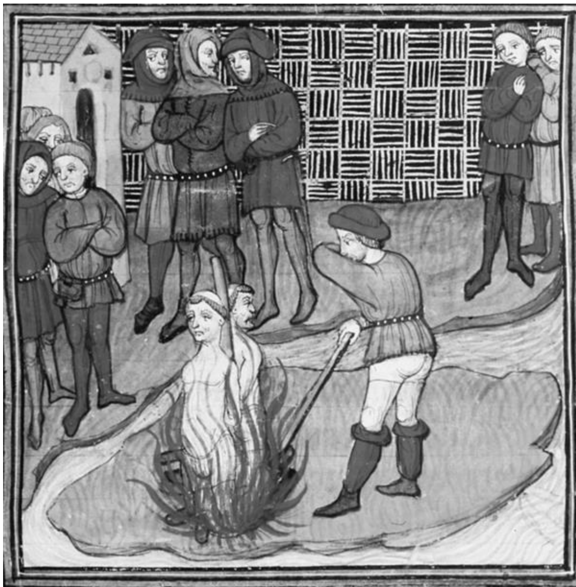
Казнь Жака де Молле. Миниатюра XIV в.

Итак, эта речь стала воззванием к Божьему суду, который в то время и при той картине мира был ничуть не слабее человеческого и королевского. Вера людей делала мир необъятным, а земная жизнь была лишь малой частицей божественного мироздания.