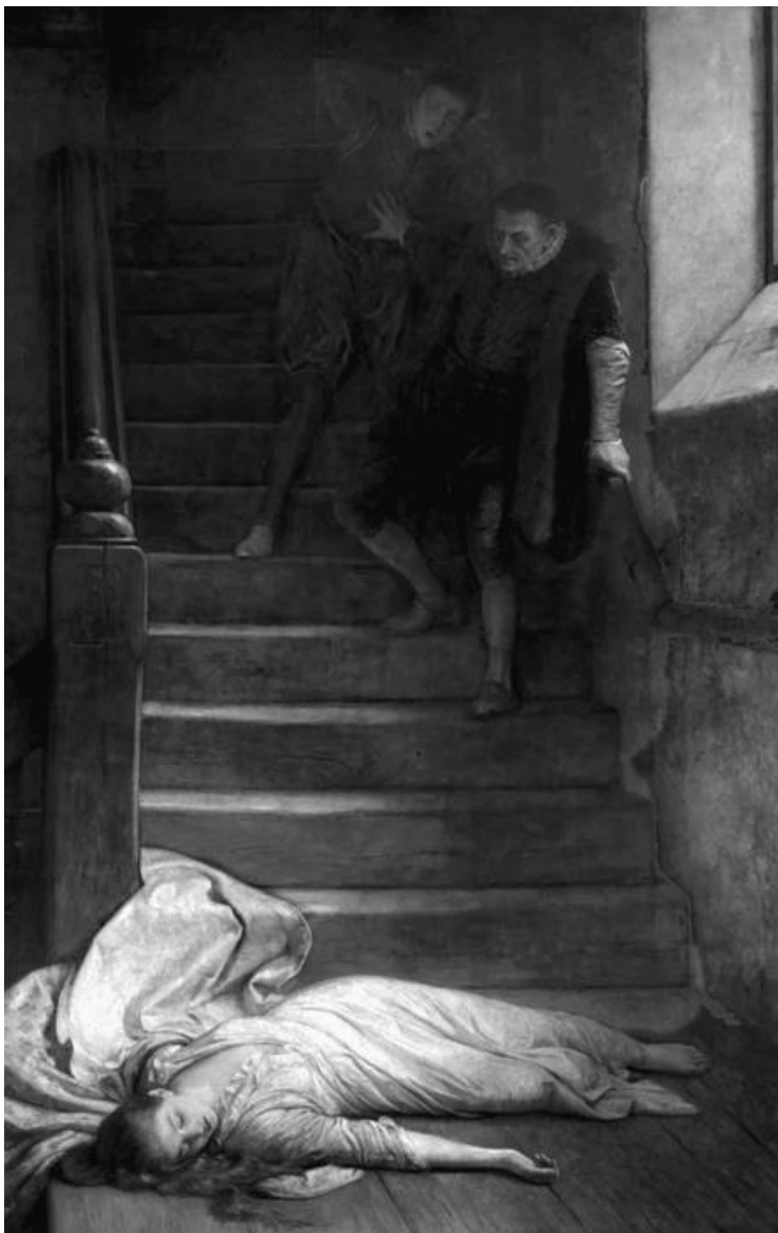
Смерть Эми Робсарт Дадли. Художник У. Ф. Йимз. 1877 г.