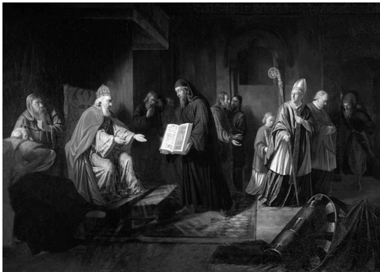
Великий князь Владимир избирает религию. Художник Иван Эггинк. 1822 г.

Младший же брат, Владимир, при этом известии «убояся, бежа за море» в варяжские земли, то есть в Швецию. Набрал там войско из наемников, он вернулся в Новгород и выгнал посадника Ярополка. Однако мало показалось Владимиру своей вотчины, и он, почувствовав силу, решил и остальные земли у старшего брата отвоевать. И происходило это самым подлым и вероломным образом.