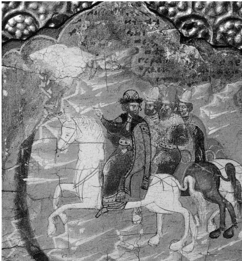
Московский князь Иван Калита. Клеймо иконы «Митрополит Петр с житием». XVII в.

Псковичи поцеловали крест и отпустили Александра в Литву, хотя очень горьки были им его проводы: тогда, гово-