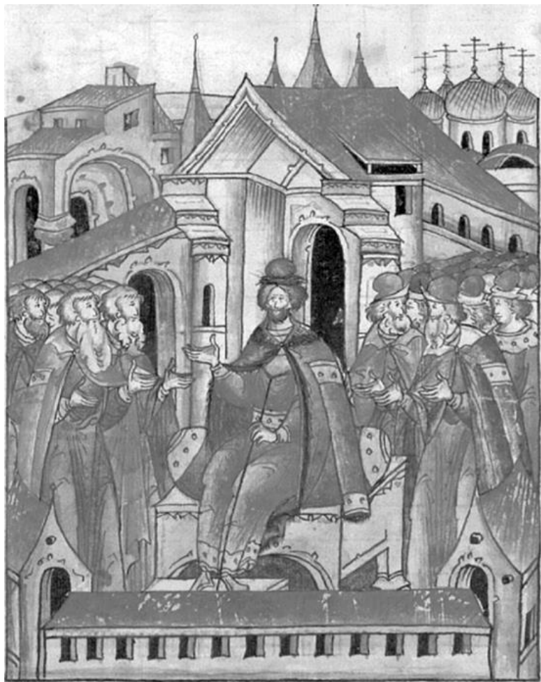
Великий князь Владимир Мономах на Киевском престоле. Лицевой летописный свод. XVI в.