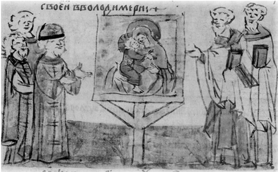
Поставление Владимирской иконы во Владимирской Богородицкой церкви. Радзивилловская летопись. XV в.

– Спаса и Покрова, и при нем создается целый цикл литературных произведений: «Слово Андрея Боголюбского о празднике 1 августа», «Житие Леонтия Ростовского» и т. д.