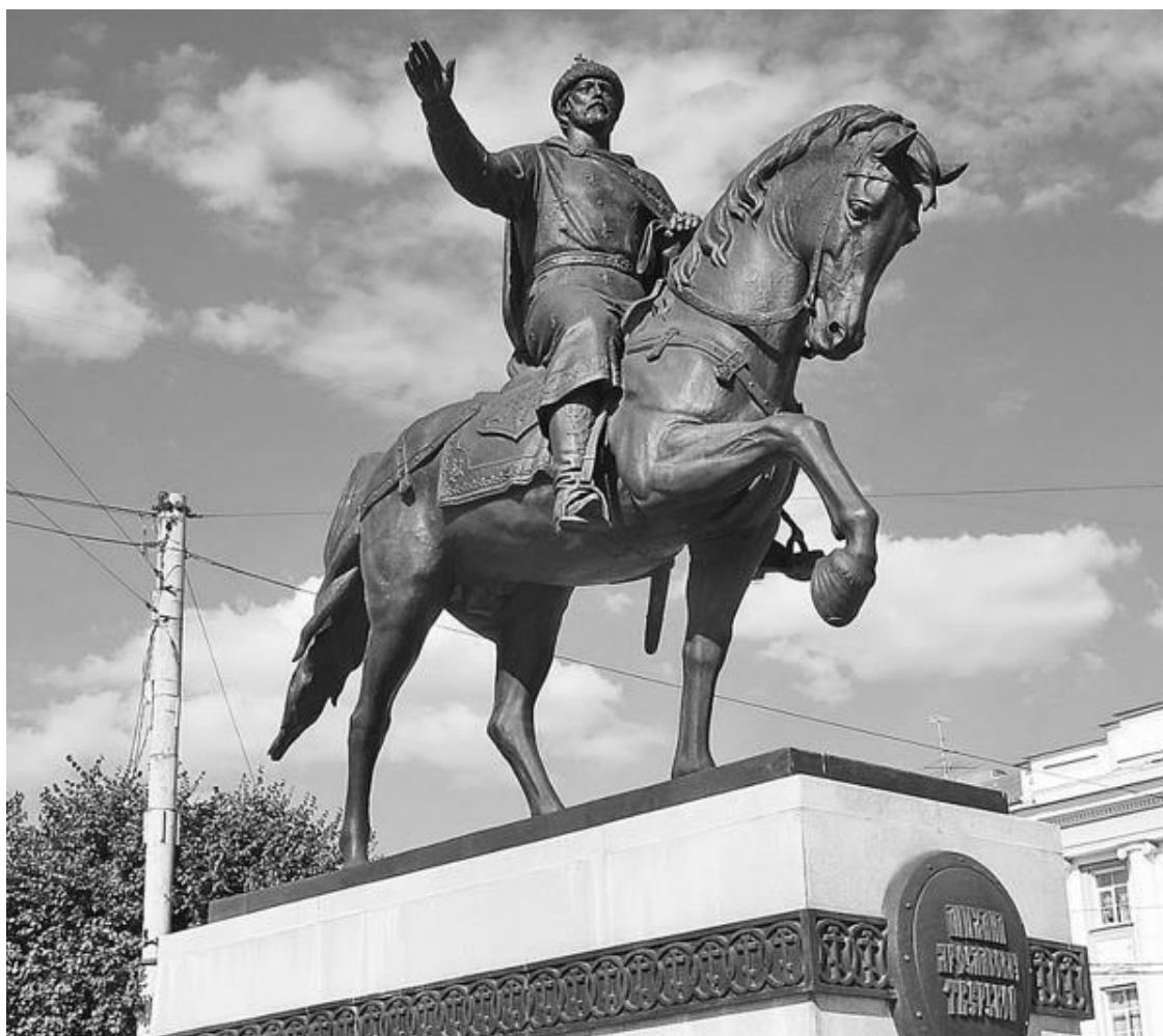
Памятник князю Михаилу Ярославичу в Твери

Между тем Юрий явился опять у Волги, и с ним весь Новгород и Псков. Тверской князь вышел к неприятелю навстречу, но битвы не было: заключили договор, по которому оба соперника обязались идти в Орду и там решать свои споры; Михаил обещал также освободить жену Юрия и брата. Но жена Юрия Кончаковна не возвратилась в Москву: она, к несчастью, умерла в Твери.