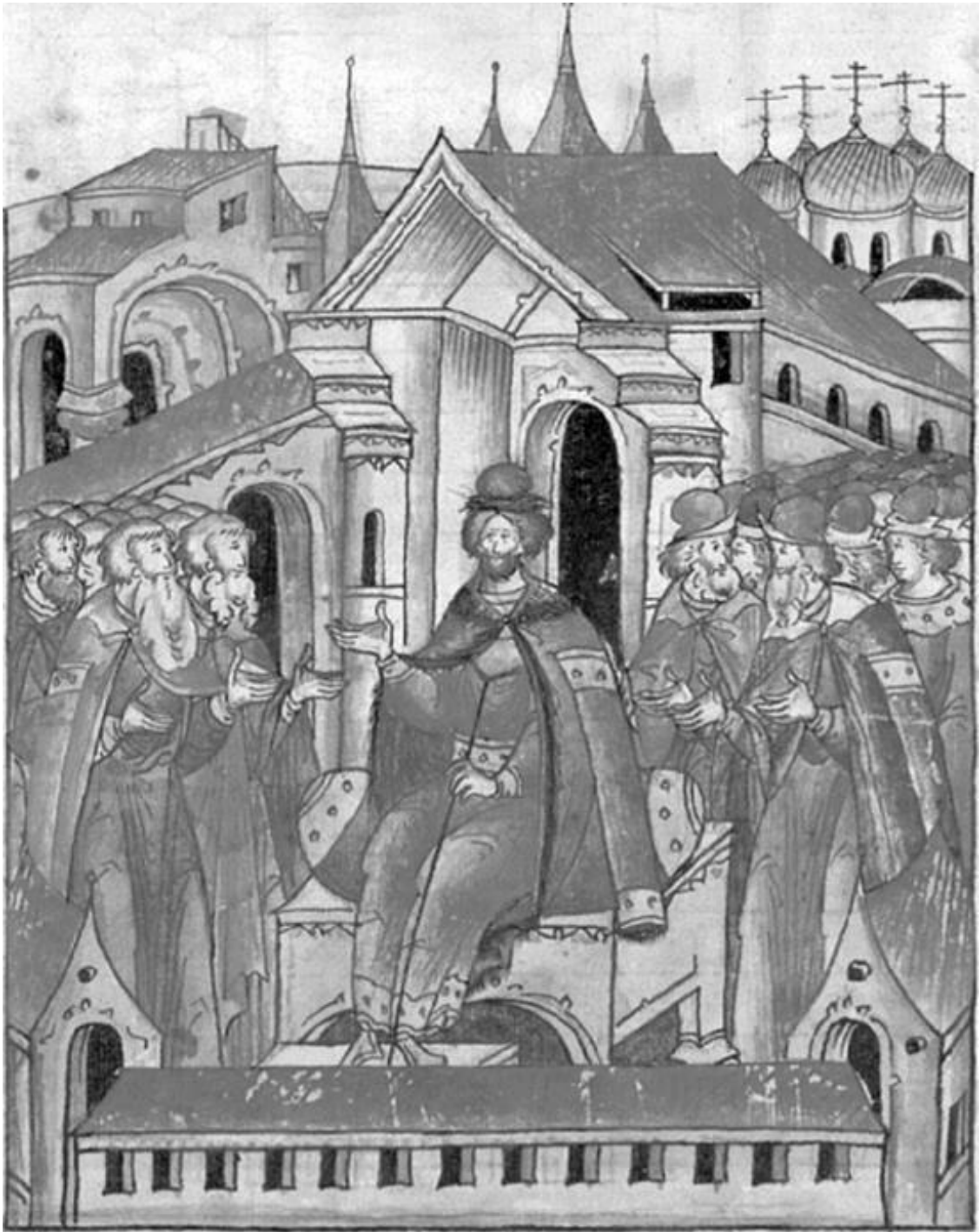
Великий князь Владимир Мономах на Киевском престоле. Лицевой летописный свод. XVI в.

После смерти Ярослава, в соответствии с завещанием, его сыновья разделили земли между собой. Но наследовать Киев – «мать городов русских» – могли только три старших брата – Изяслав, Святослав и Всеволод по очереди. Такой порядок замещения княжеских столов историки назвали «лествичным». Вроде порядок был понятен, но братья стали враждовать с племянниками.