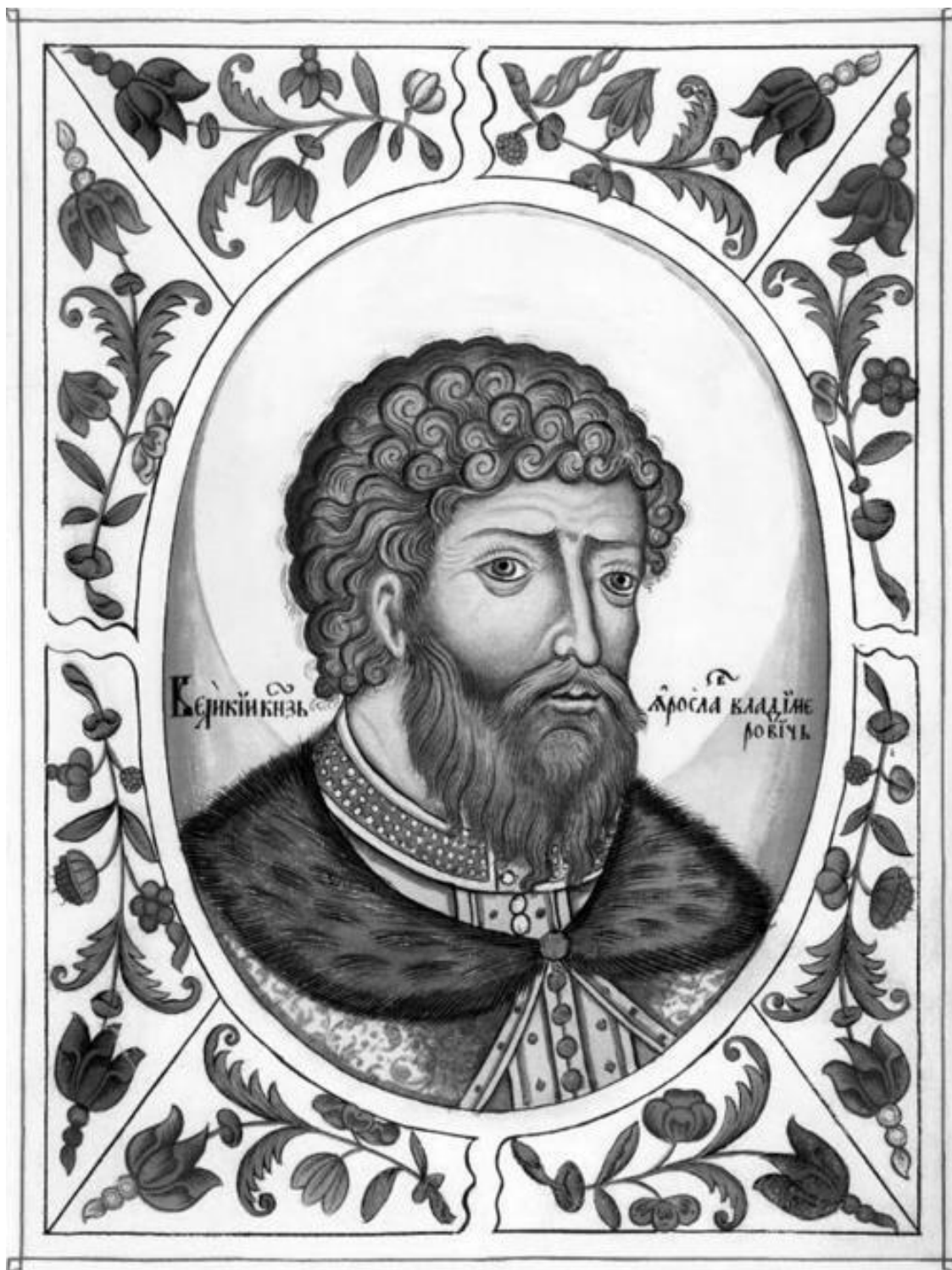
Великий князь Ярослав Мудрый. Портрет из Царского титулярника. 1672 г.

Вскоре Ярослав должен был начать еще более трудную борьбу с младшим братом Мстиславом Тмутараканским, который требовал от него раздела русских земель поровну и подошел с войском к Киеву. Ярослав собрал против Мстислава большое войско, произошла жестокая сеча, а в 1025 году он заключил с братом мир, по которому земля Русская была разделена на две части по Днепру: области по его восточную сторону отошли к Мстиславу, а по западную – к Ярославу.