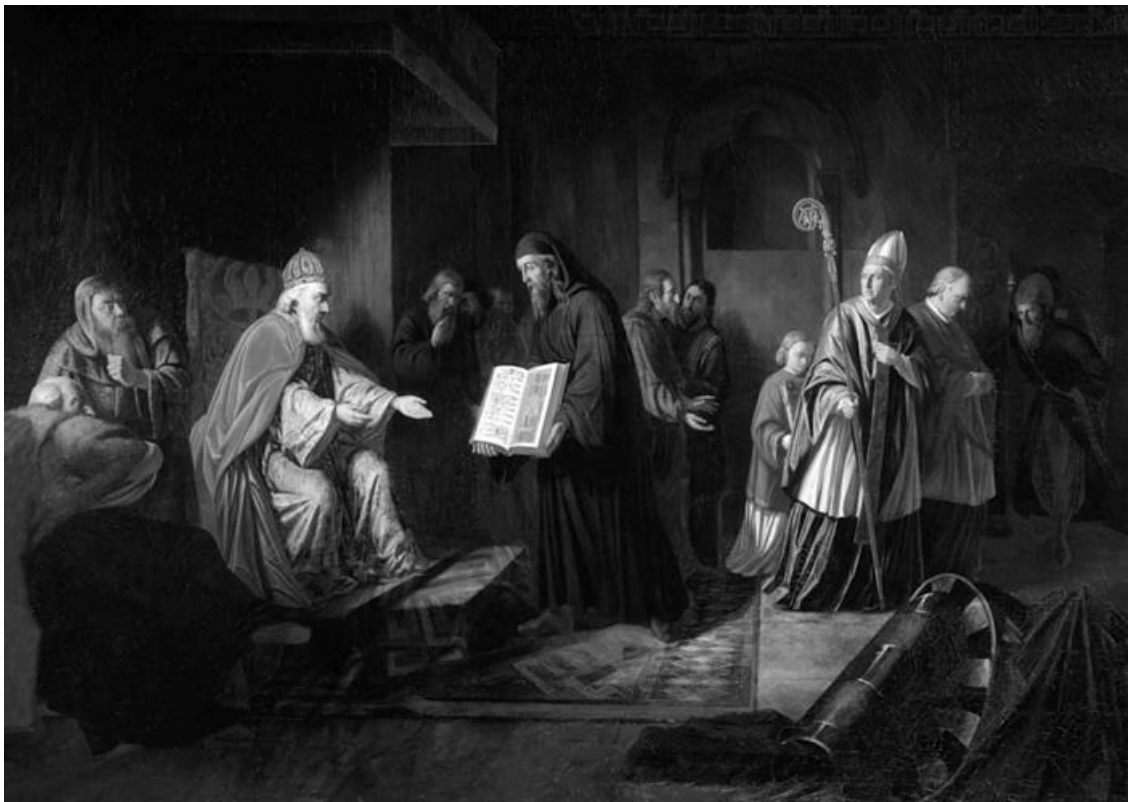
Великий князь Владимир избирает религию. Художник Иван Эггинк. 1822 г.

Младший же брат, Владимир, при этом известии «убояся, бежа за море» в варяжские земли, то есть в Швецию. Набрал там войско из наемников, он вернулся в Новгород и выгнал посадника Ярополка. Однако мало показалось Владимиру своей вотчины, и он, почувствовав силу, решил и остальные земли у старшего брата отвоевать. И происходило это самым подлым и вероломным образом.