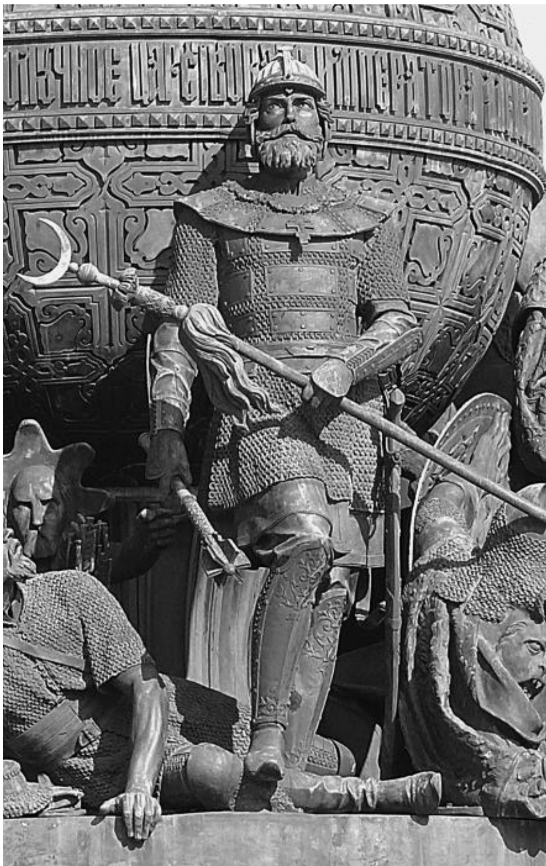
Дмитрий Донской на памятнике «Тысячелетие России» в Великом Новгороде