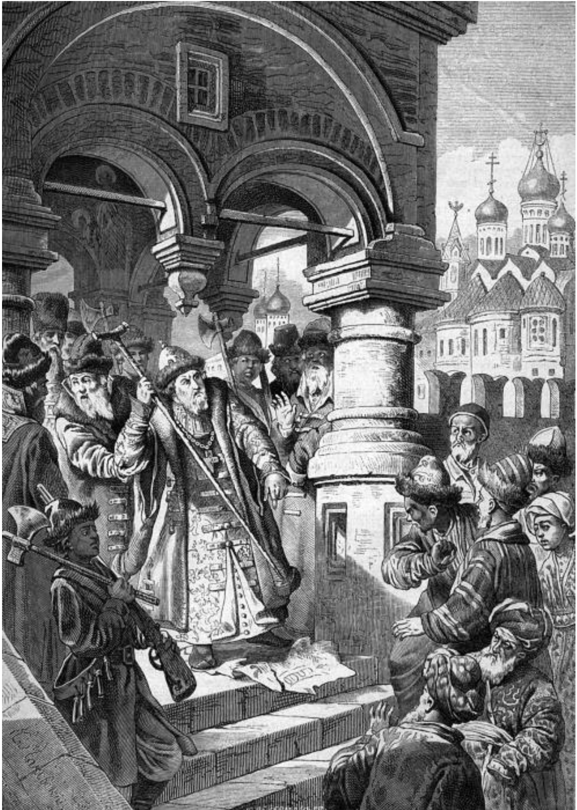
Иоанн III и татарские послы. Рисунок К.Е. Маковского. 1870 г.

Однако до полного подчинения новгородских земель было еще далеко. Весной 1477 года часть новгородского боярства отправились с посольством в Москву, чтобы подтвердить свою верность великому князю и преподнести ему дары. Но по возвращении домой их ждали разгневанные новгородцы, и несколько бояр были убиты. Народное вече выбрало правительство