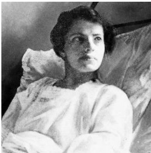
Фройляйн Унбеканит в больнице

Квартира наполнилась чадом, и Эрна Бухольц, тяжело переваливаясь на плоских ступнях, поспешила спасать гренки. На сегодня ее ужином были ячменный кофе и ломтики поджаренной булки. Ее Эрна купила с уличного лотка за полцены, потому что булка была слегка тронута плесенью. Не страшно: обскоблила, остальное уничтожит сковородка. Пятнадцать пфеннигов сэкономила.