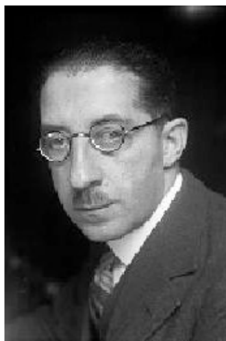
Начальник берлинской политической полиции Райнхард Вайс

Она отметила едва заметную тень сомнения, промелькнувшую на лице доктора. И подумала, что известное немецкое уважение и даже рабское преклонение перед властью и законом, похоже, истаяли в германской демократической республике, которую еще называли Ваймарской.