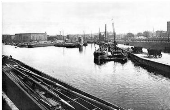
Ландверский канал. Берлин

Был февраль, шел отвратительный ледяной дождь пополам со снегом. Проходя мимо моста, сержант Халльсман услышал крик, потом плеск воды. Он бросился к ограде канала, включил электрический фонарик и увидел спину утопленника в воде. Очевидно, самоубийца не рассчитал и глотнул лишнего воздуха. Течение медленно увлекало тело вниз.