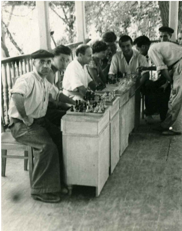
Отец даёт сеанс одновременной игры в бывшей резиденции эмира бухарского (санаторий «Мохи-Хоса», Бухара, ко-