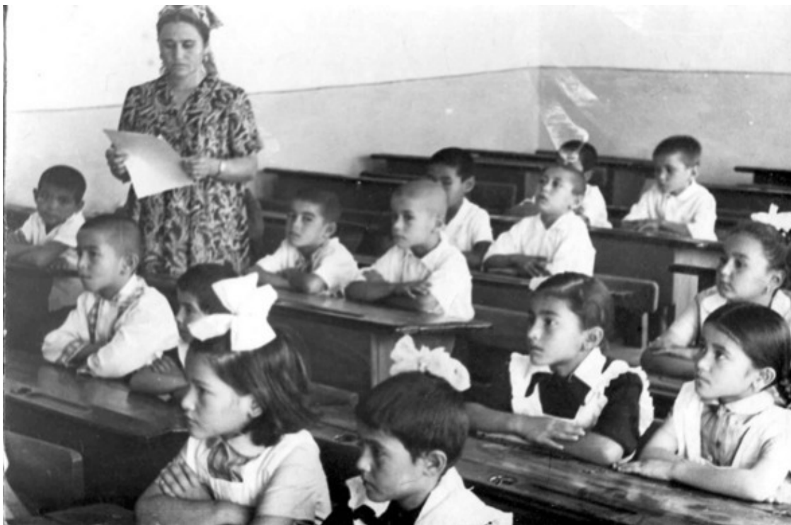
Мама – учительница начальных классов

Ма-ма мы-ла ра-му... Это – мы-ло. (Из Азбуки советских времён)