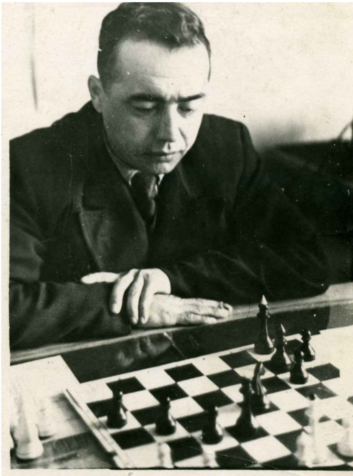
Отец. Фото нач. 50-х гг XX столетия.

Мой отец поровну поделил свою жизнь между семьёй и не менее родной его сердцу редакцией «Бухоро хакикати» («Бухарская правда»), которой он отдал более 30 лет своей жизни, проработав в ней сначала в должности ответственного секретаря, а затем заместителя редактора этого главного рупора местного обкома партии.