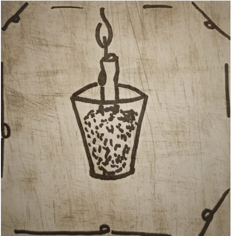
Ритуал 2 Свеча и соль

чи, то можно взять парафиновую белого цвета. А соль может быть крупная или мелкая, любая. В целях безопасности не стоит также оставлять свечу надолго без присмотра.