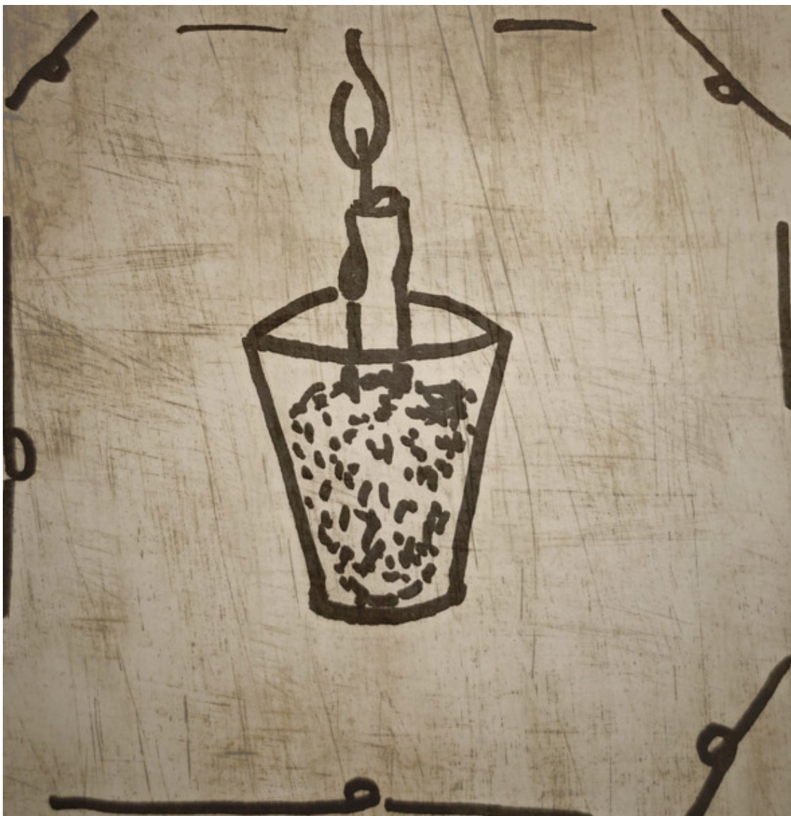
Ритуал 2 Свеча и соль