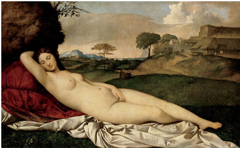
Спящая Венера Джорджоне (1510 год)

Разгневанная богиня решила отомстить ни в чём неповинной девушке и подстроила так, что та сильно оскорбила своего отца. Придя в бешенство, тот решил убить её и выхватил меч. Перепуганная Смирна бросилась бежать. Но у края глубокого обрыва царь настиг её и занёс над её головой острый меч. Однако в последнюю секунду Афродита решила спасти Смирну и превратила её в мирровое дерево (по-гречески оно как раз и называется смирна ). Но разъярённый царь уже не мог остановиться и разрубил своим мечом дерево пополам.