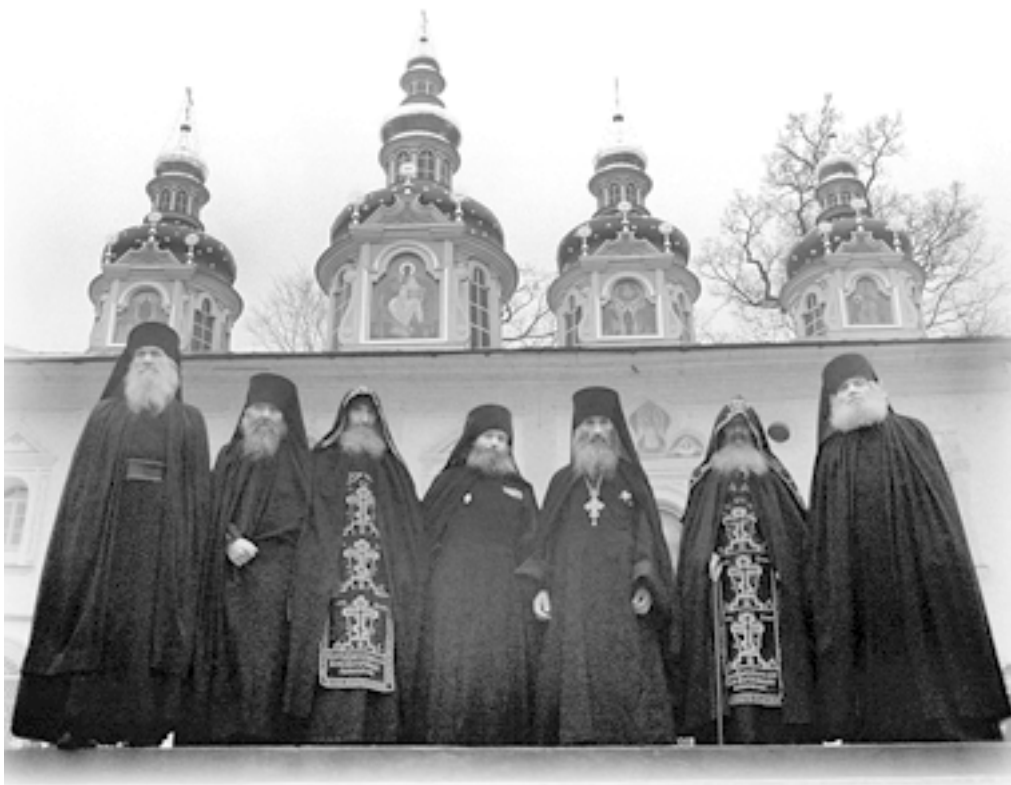
Печерские монахи – ветераны войны. 9 мая 1984 года

Не могу сказать, какие арсеналы хранились в монастыре. Скорее всего, это была военная хитрость Великого Наместника, его очередная грозная шутка. Но, как говорится, «в каждой шутке есть доля шутки». В те годы братия обители, несомненно, представляла собой особое зрелище – больше половины монахов были орденосцами и ветеранами Великой Отечественной войны. Другая часть – и тоже немалая – прошла сталинские лагеря. Третьи испытали и то и другое.