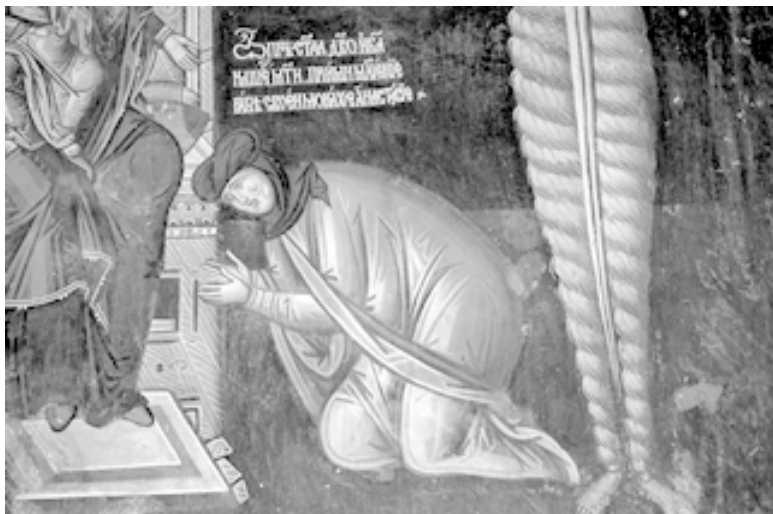
Моление преподобной Анастасии. Фреска в монастыре Студеница