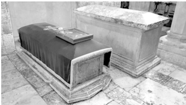
Место упокоения преподобной Елены. Вознесенский со-

Несколько лет иноверец осквернял и разорял кельи Дечанской лавры. Он даже вознамерился превратить Вознесенский собор в мечеть. Но, когда турки собрались у храма для этого безумного предприятия, гнев Божий смертельно порастил турецкого муллу и уничтожил осквернителей пламенем, вырвавшимся из могил святого короля Стефана и его сестры Елены.