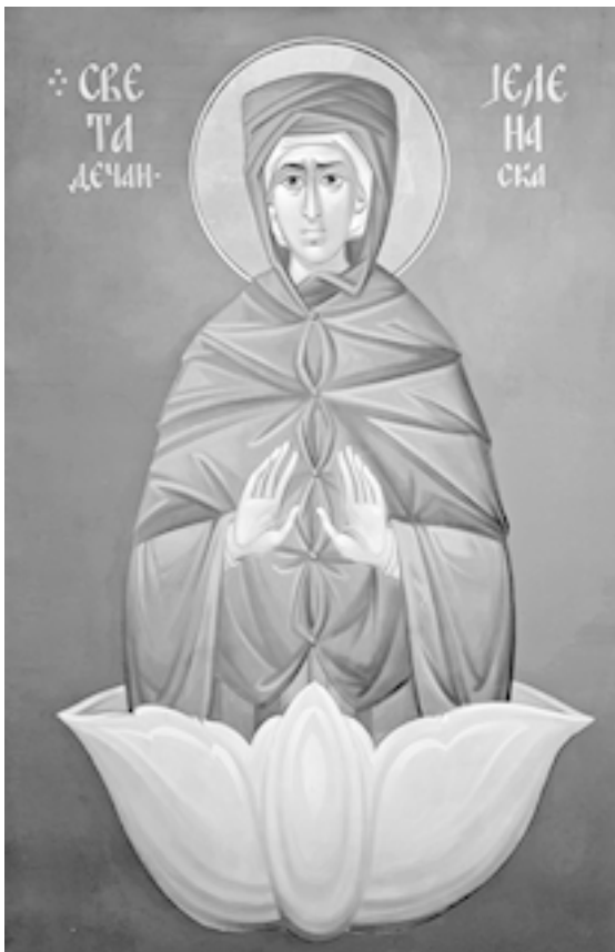
Преподобная Елена Дечанская. Современная фреска. Белград

Начало почитания святой Елены связано с одним чудес-