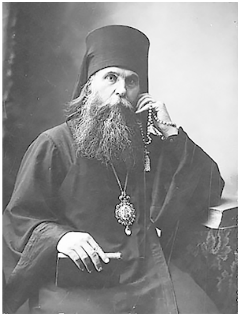
Епископ Бирский Трофим (Якобчук)