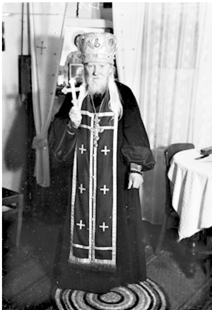
Архимандрит Афиноген Ок. 1978 г.