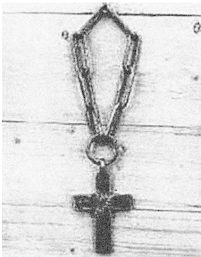
Крест преподобного Макария. Фото начала 1910-х гг.

Величайшей святыней монастыря были вериги преподобного Макария Римлянина, столетиями выставлявшиеся для почитания верующими. Их нужно было спасти.