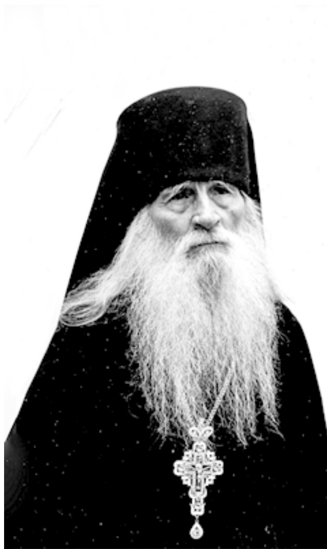
Схиархимандрит Пимен (Гавриленко)

Еще одно проявление дара прозорливости старца засвидетельствовано в воспоминаниях жительницы тогдашнего Ленинграда, госпожи Рыжовой, посетившей Печерскую обитель весной 1969 года.