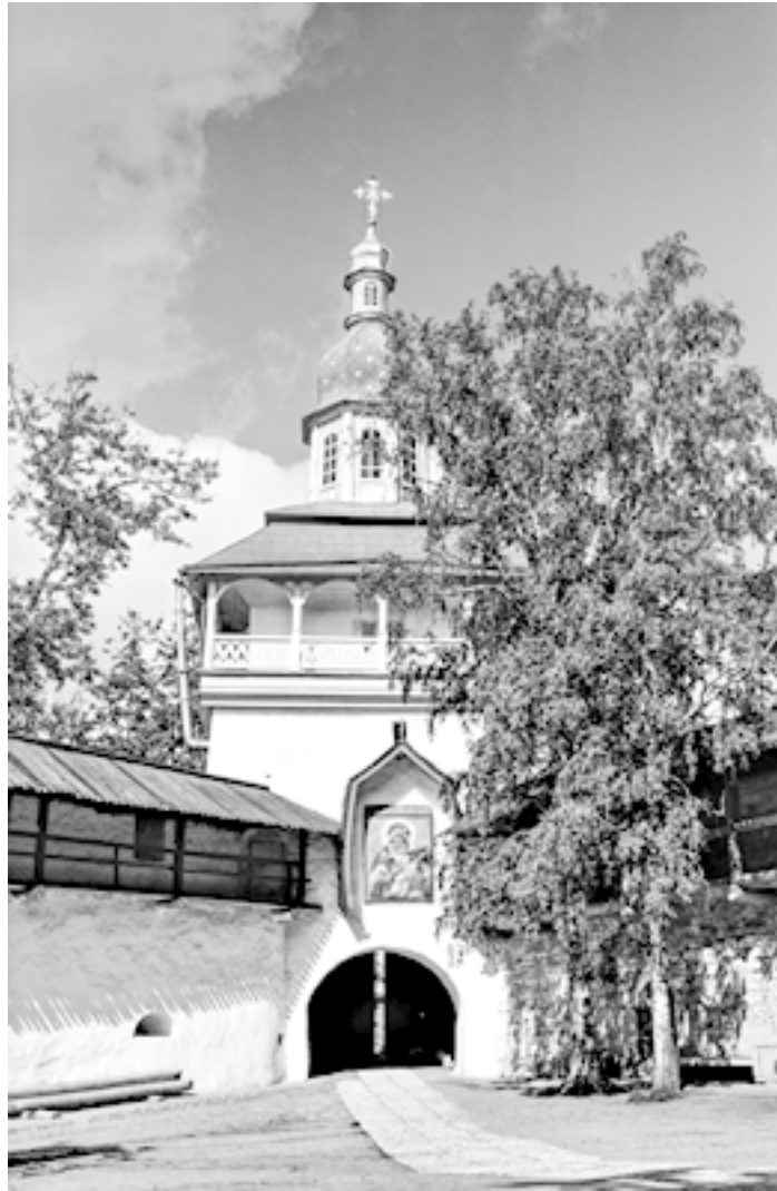
Святые врата Псково-Печерского монастыря. Фото третьей четверти XX века

Однако батюшка – будучи конечно же одним из достойнейших печерских иноков – всегда оставался преисполнен самого глубокого смирения и часто говорил о всеобщем нашем недо-стоинстве пред Господом. Как-то раз я спросила его по поводу сильно болевших язв у него на ногах: “Вы, батюшка, верно, очень от них страдаете?” Он ответил (одновременно – с самоукорением и со столь свойственной ему порой шутливостью): “Мы страдаем – за вас, а вы – за нас, за грехи поповы – за то, что нынче мы, попы, бестолковы”. Все это, разумеется, он гово-рил оттого, что сам считал всякое самоукорение, осознание своей греховности драгоценным христианским даром и что скорбь о своих грехах как раз и отличает нас от безбожников, делая нас – через наше же покаяние – “Христовыми”.