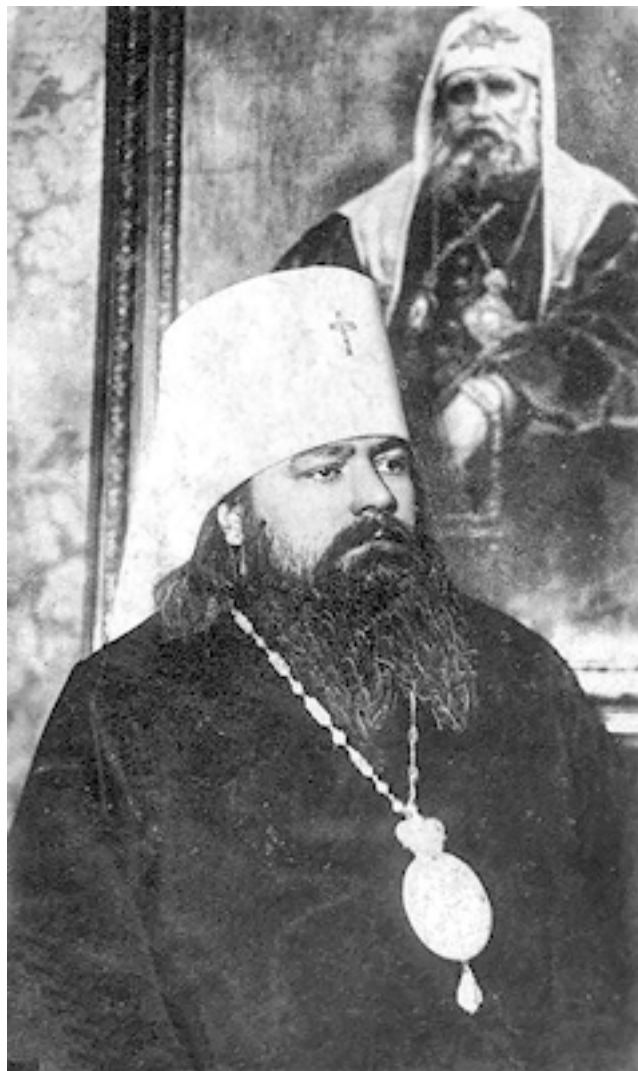
Митрополит Сергей (Воскресенский)

В результате появилась реальная возможность вновь начать служить во многих закрытых ранее большевицкой властью храмах: в Прибалтике, в Псковской области, а также частью в Ленинградской и Новгородской областях в то время действовала так называемая Псковская миссия 37 , поддерживаемая выдающимся святителем, неизменно остававшимся в юрисдикции Московской Патриархии, – митрополитом Литовским Сергием [16] (Воскресенским). В Миссии было задействовано большое число представителей православного клира, среди которых оказался и отец Афиноген.