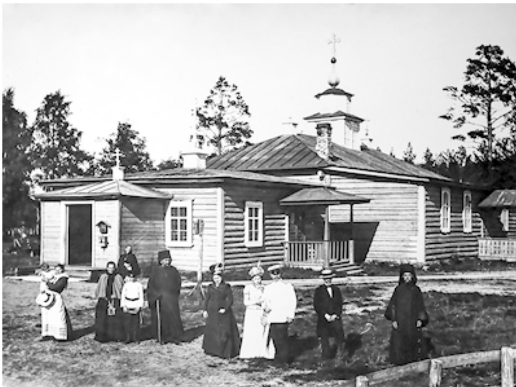
Воскресенско-Макарьевская пустынь. Успенская церковь. Фото 1902 года

Обитель же постепенно начала расширяться и укрепляться, а в 1912–1915 гг. в ней был наконец построен и каменный храм – во имя святого Архангела Михаила.