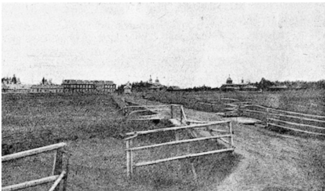
У околицы Макарьевского монастыря

Я сказал, что из Петербурга. Он говорит: “Какую имеешь специальность?” Я сказал, что могу шить одежду. Он говорит: “Ох, милый, нет, тебя я не возьму. Я знаю – петербургские жители мастеровые все порченые, балованные. Наверное, ты убежал от хозяина, у нас хочешь укрыться. Нет, милый, поезжай обратно к хозяину”.