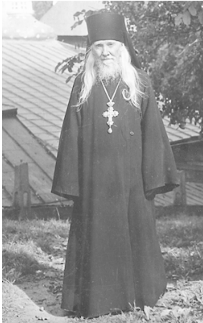
Старец Псково-Печерского монастыря архимандрит Афиноген, в схиме Агапий (Агапов)

В последние десятилетия своего жития (ибо в это время жизнь его уже, по сути, претворилась в «житие») старец сподобился различных явлений «мира иного» – когда перед ним раскрывались радостные и дарующие надежду на спасение чудные картины райских обителей. В такие минуты отец Афиноген, по собственному его свидетельству, предстоял Господу, Царице Небесной, святым угодникам Божиим.