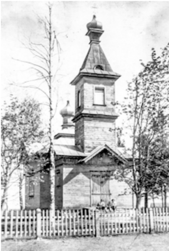
Никольский храм в Гегобростах

ствует о подвижничестве и мудрости батюшки.