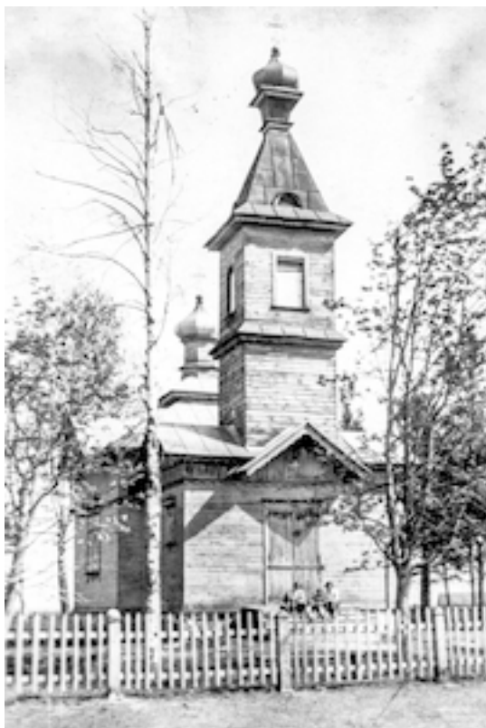
Никольский храм в Гегобростах