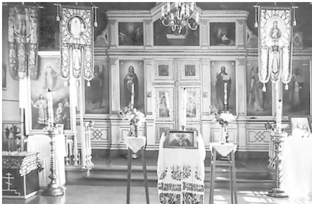
В Никольском храме в Гегобростах