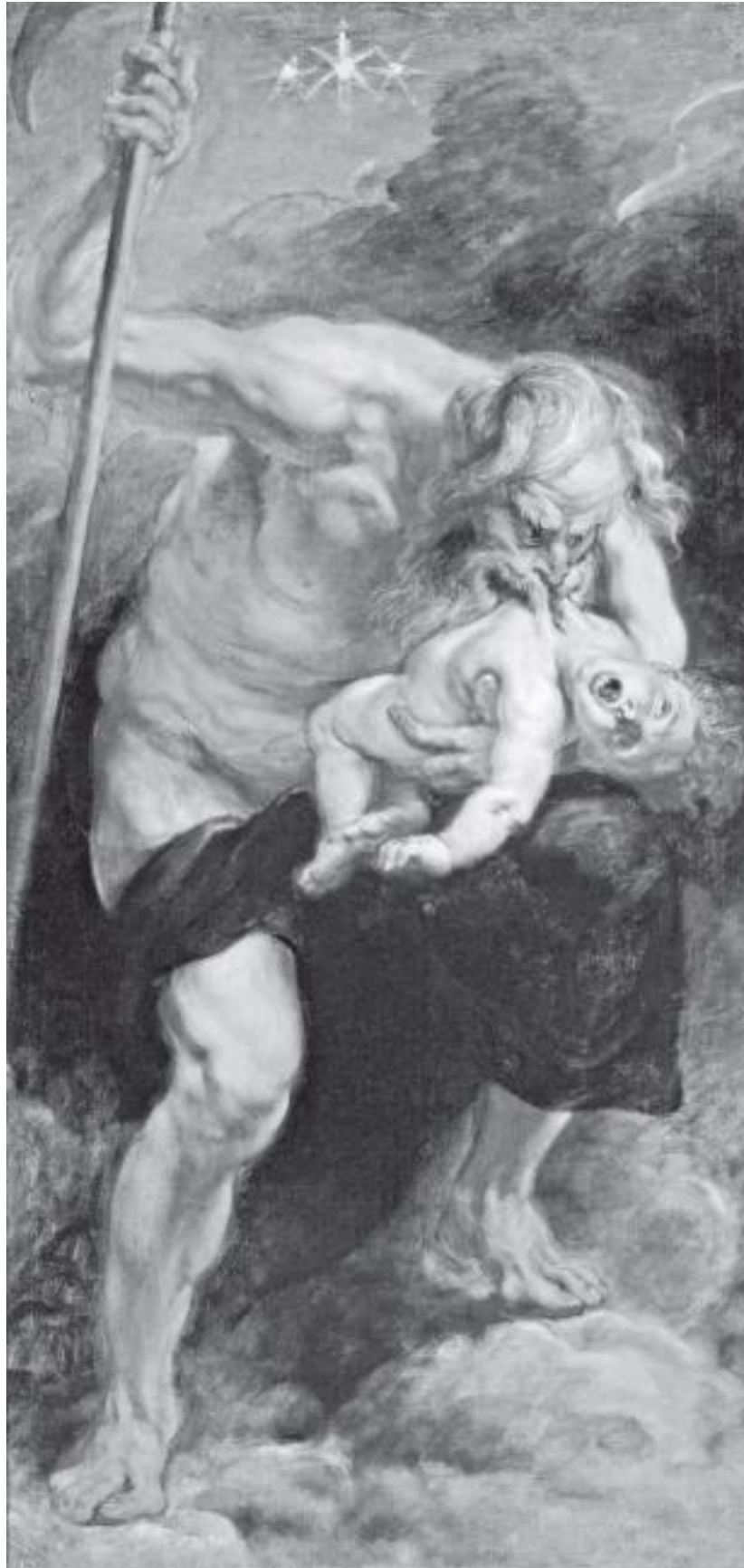
Питер Пауль Рубенс. Сатурн, пожирающий Сына. 1636–1638 гг.