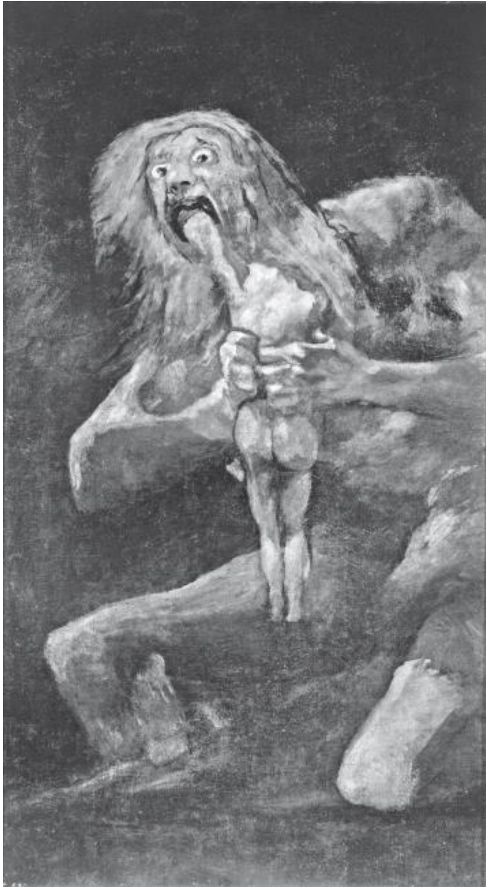
Франсиско де Гойя и Луциентес. Сатурн. 1820–1823 гг.