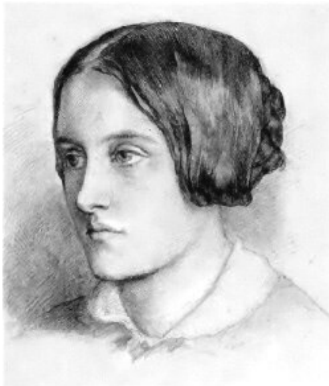
Кристина Россетти (портрет кисти Данте Габриэле Россетти)

Судя по её до некоторой степени идеализированным изображениям, исполненным её братом Габриелем Россетти, Кристина – подросток была очень привлекательна, и даже красива. В возрасте 18 лет она позировала для картины Россетти The Girlhood of Mary Virgin (for Mary) , а в 20 лет в том же образе для Эссе Ancilla Domini .