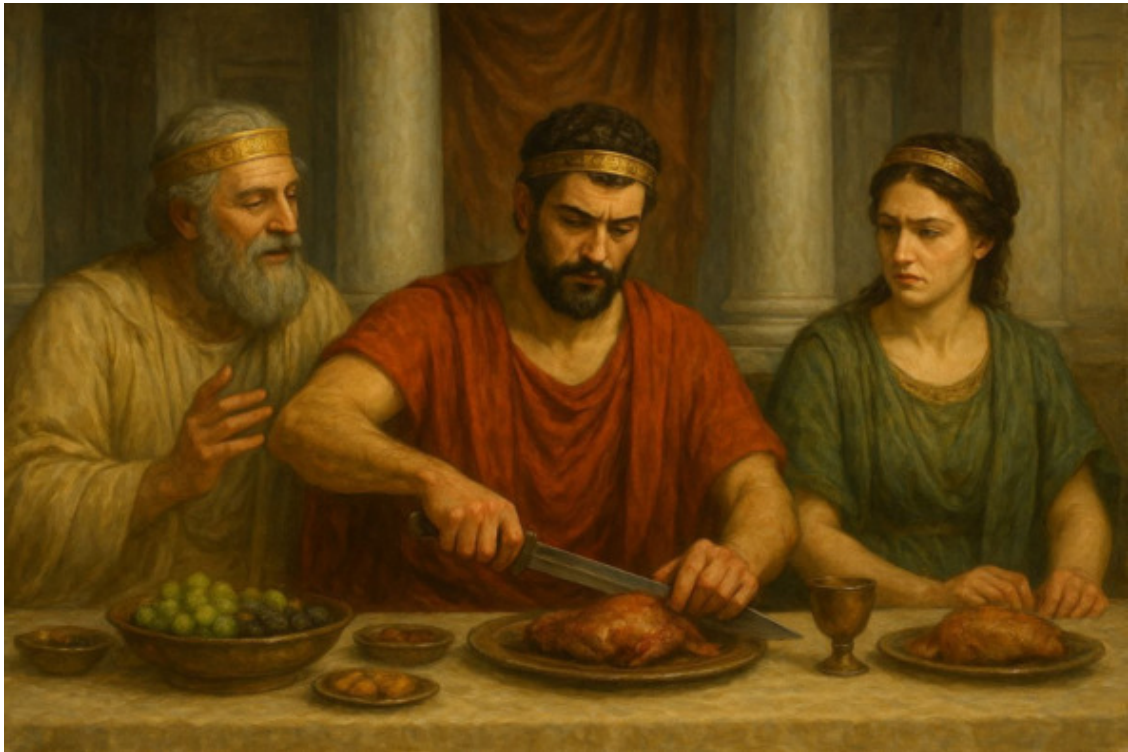
8. Тесей на пиру вынул свой меч.

Вынул меч свой. Вдруг увидел Царь Эгей на этот раз. Меч и сына рядом сидя. Пелена спадает с глаз.