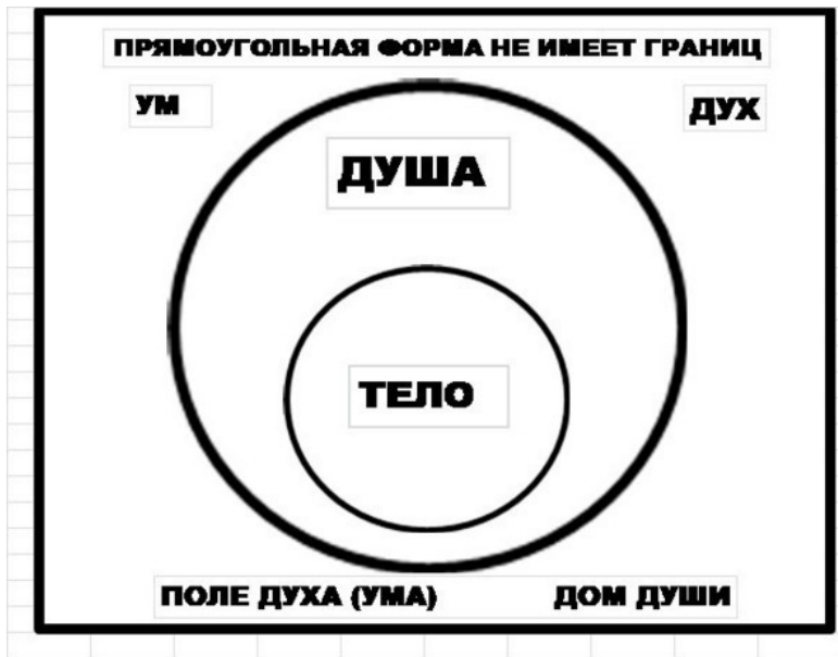
Рис. 1 ТЕЛО, ДУША И ДУХ Три области: тело, душа и дух.