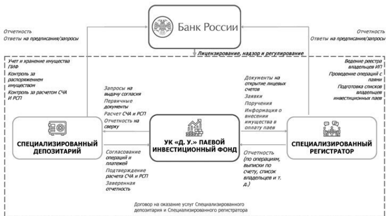
Рисунок 6. Специализированный депозитарий и специализированный реги-