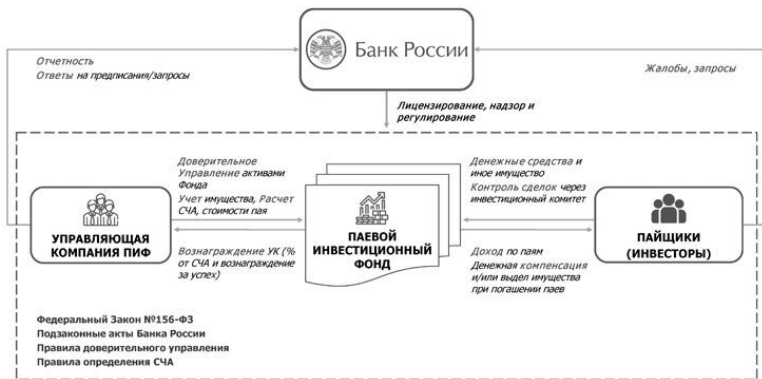
Рисунок 5. Управляющая компания паевого инвестиционного фонда

Управляющая компания и пайщики создают паевой инвестиционный фонд. Как это происходит на практике? Может показаться, что фонд создает управляющая компания, так как именно она разрабатывает правила доверительного управления фондом, регистрирует их в Банке России (или согласовывает в специализированном депозитарии, если это фонд, пай которого предназначены для квалифицированных инвесторов), определяет инвестиционную декларацию фонда, выбирает конкретных субъектов инфраструктуры для фонда. Но это будет верно лишь для открытых, интервальных и биржевых паевых инвестиционных фондов, предна-