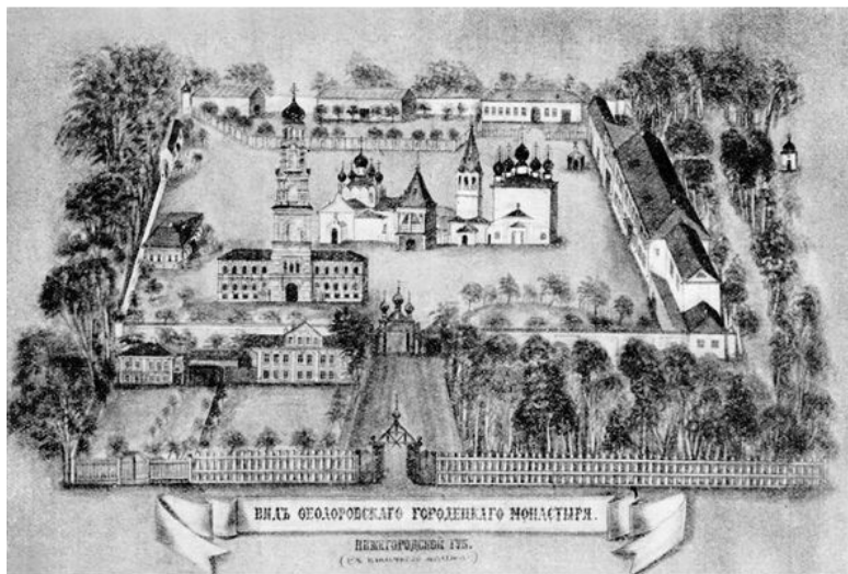
Рис. 1. Вид Феодоровского Городецкого монастыря

Основатель Городца Радилова князь Георгий Владимирович Долгорукий, идя навстречу как желанию своих горожан, так и собственному побуждению, чтобы эта святая икона была принесена на молебствие по случаю постройки храма, дал повеление торжественно перенести ее из часовни на предполагаемое место. В назначенное время князь, клир и народ пришли с крестным ходом к часовне и после молебных пений хотели поднять святую икону с того места, где она стояла. И вот тут-то (как говорит первое предание) совершилось знамение Божие. К великому изумлению всех, икона,