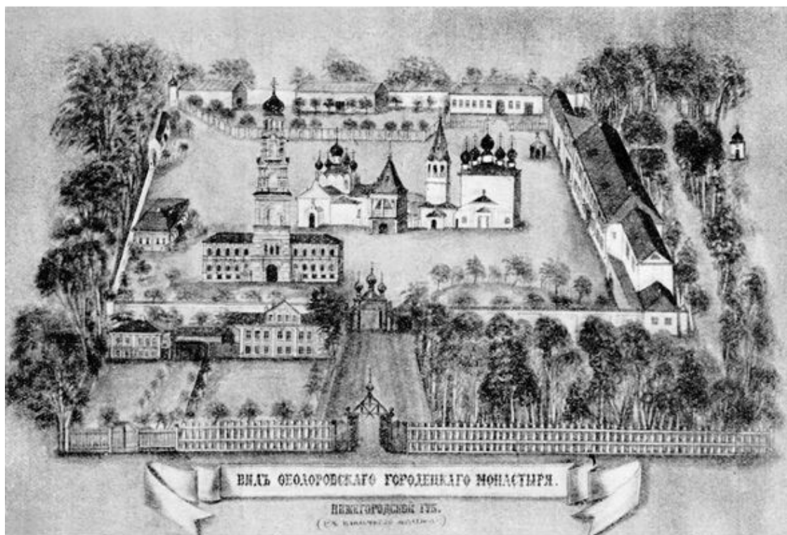
Рис. 1. Вид Феодоровского Городецкого монастыря

Кем, когда и откуда она была принесена на это место сведений нет. Православные жители Городца, со времени своего поселения здесь, особенно чтит эту святую икону и им было очень желательно видеть ее в новом соборном городском храме во имя Архистратига Михаила, который уже строился в то время.