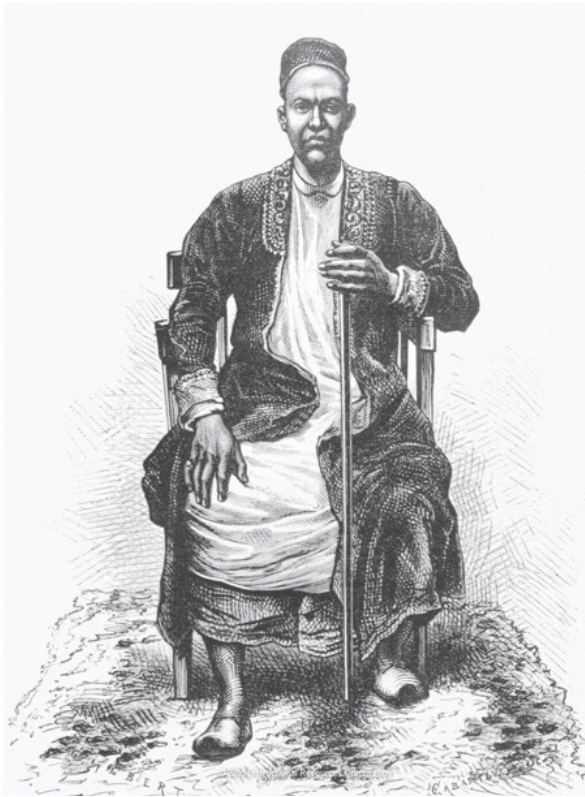
Мутеса в арабском халате (рисунок XIX века)

Затем Мутеса встал и ушел, отправив посланников за мной.