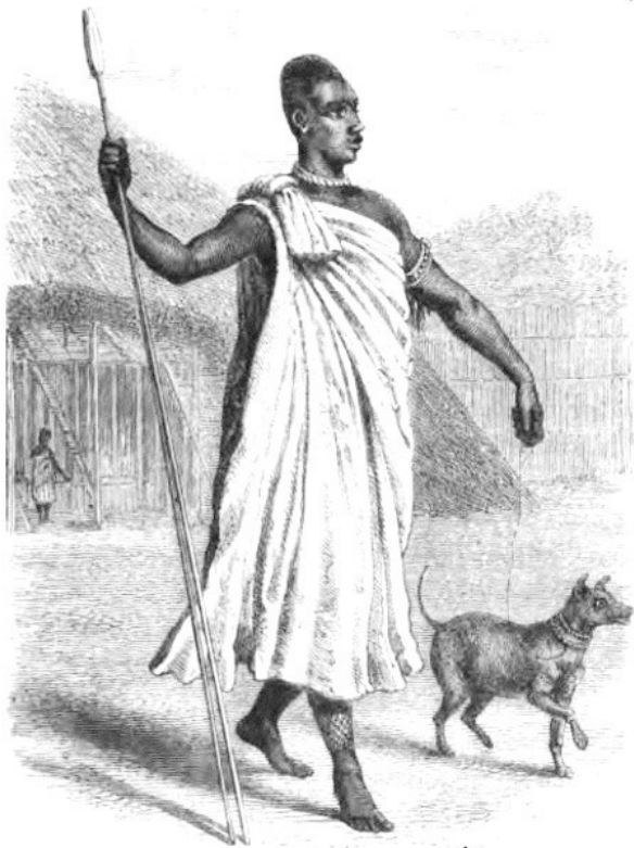
Мутеса, король Уганды

«Герольды» возвестили, что «могущественный король» воссел на своем троне в государственной хижине третьего яруса. Я двинулся вперед, держа шляпу в руке, с моим почетным караулом, за которым следовали носильщики, несущие