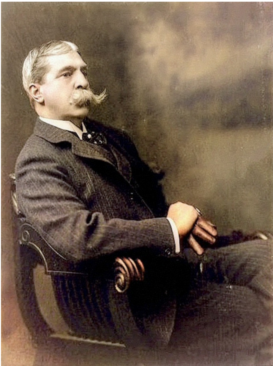
Фрэнсис Хопкинсон Смит, фото начала XX века

Одновременно он занимался и своим любимым делом – рисованием углем и акварелью. Когда выдавалось свободное лето, он проводил его за границей, – в живописнейших уголках Европы, а затем выставлял свои работы, которые пользовались неизменным успехом.