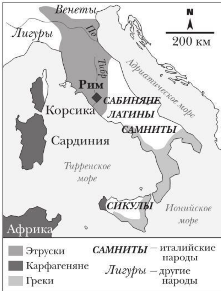
Италия в VIII веке до н. э.