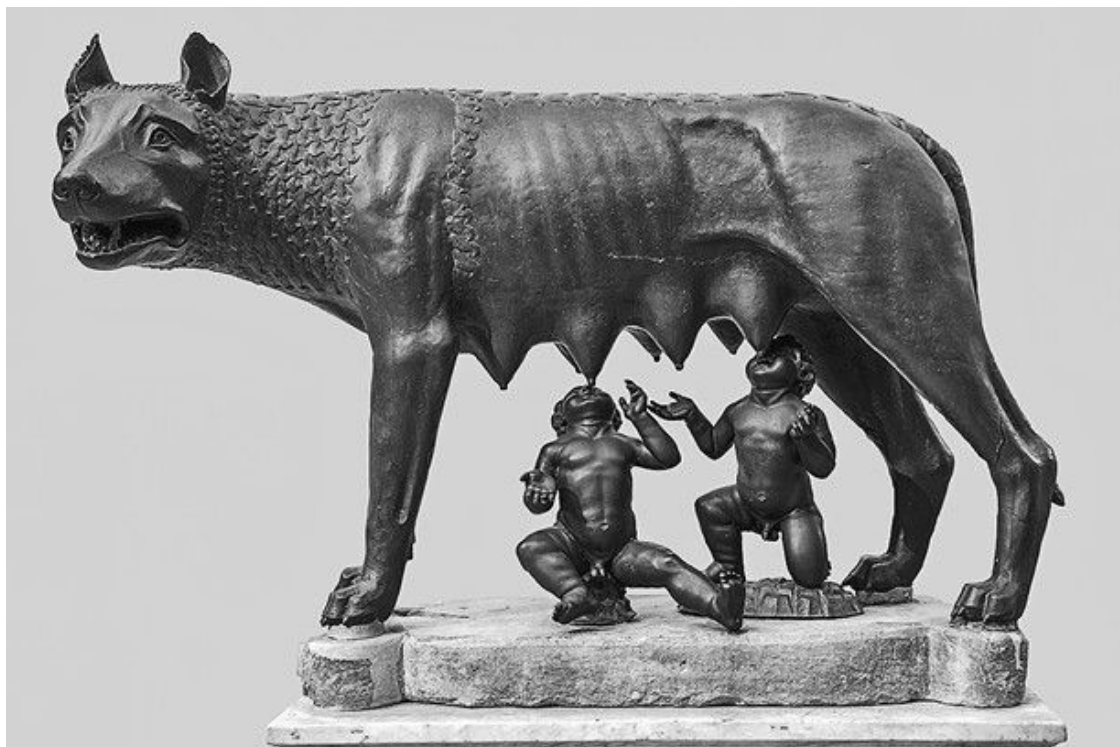
Капитолийская волчица (XI или XII век)

Эту бронзовую скульптуру, которая хранится в Капитолийском музее в Риме, долгое время приписывали этрускам и датировали V веком до н. э. Но на самом деле она была создана в середине Средневековья. В 2019 году этот факт окончательно подтвердил радиоуглеродный анализ. Фигуры близнецов добавили в эпоху Возрождения. Однако, согласно античным авторам, подобные скульптуры делали в Риме и Италии уже начиная с III века до н. э., хотя ни одна из них не сохранилась до нашего времени