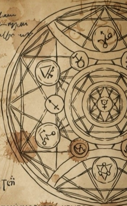
Пример алхимического круга

Handwritten symbols and text, possibly representing alchemical or magical formulas.