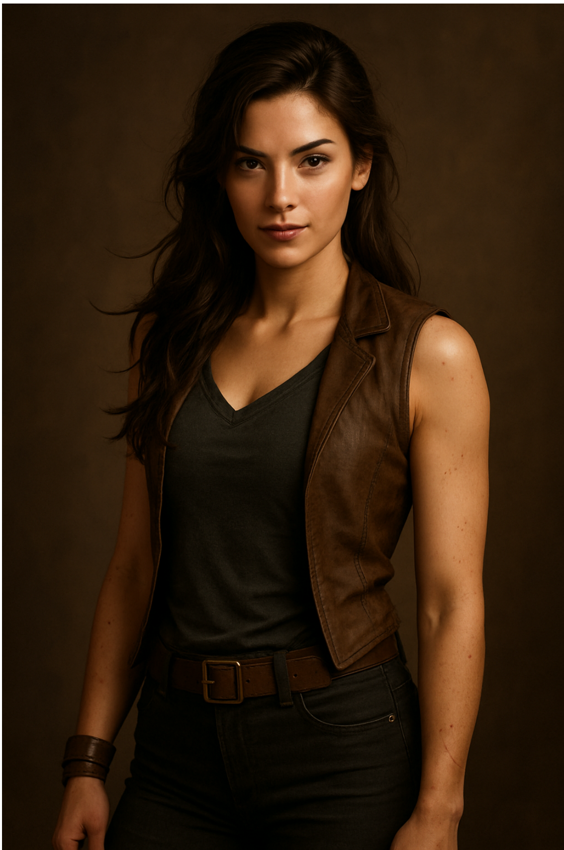
Алания (24 года) – главная героиня книги. Героиня-парадокс, она одновременно и сталь, и хрупкость; и свет, и тень.