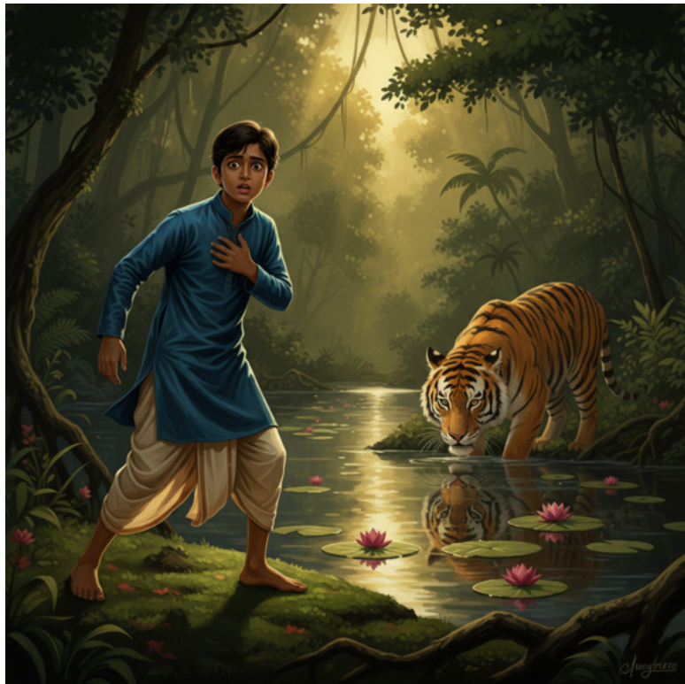
Мальчик в лесу

це. Чтобы успокоиться, она взяла планшет и начала рисовать умиротворяющий пейзаж: зелёные холмы, извилистую речку... А в голове вертелся один вопрос: почему она всегда так бурно реагирует на то, чего на самом деле нет?