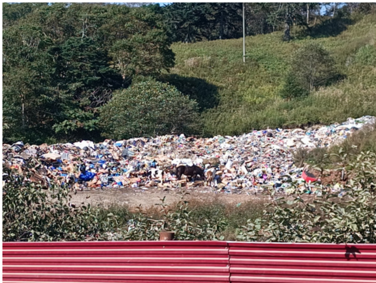
Лошадь и две коровы на свалке

Идти пешком в Крабозаводское смысла не было, поэтому я и шел туда пешком. Зато мне довелось полностью осмотреть заветную свалку с конями и коровами, налюбоваться болотами бухто-речки Отрадной и толпами японских журавлей, раскинувшими крылья на мелководе. Данная птица отличаются своей способностью сидеть на ветках деревьев в ожидании отлива. Их короткие ножки позволяют им это делать весьма виртуозно.