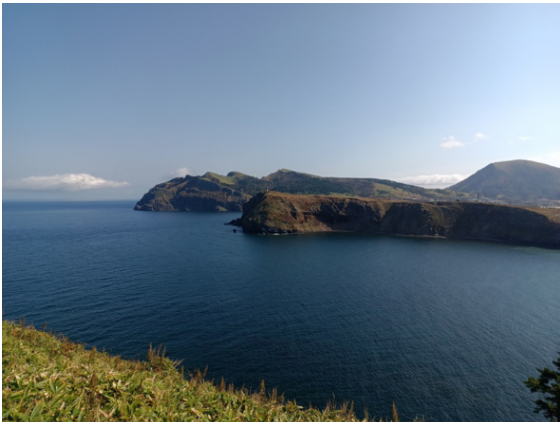
По краю. Гора Шикотан справа

Я не стал искать тропу, которая обязана быть в силу такой близости к поселку, просто пошел вблизи обрыва, чтобы видеть постепенно открывающиеся дали. И да, бамбук был моим сопровождающим. Особенность Шикотана в том, что здесь много открытых поверхностей, на которых бамбук хоть и господствует, но как то мелко, не по царственному, поэтому идти в таком злаковом сообществе не сложно, хоть и не быстро.