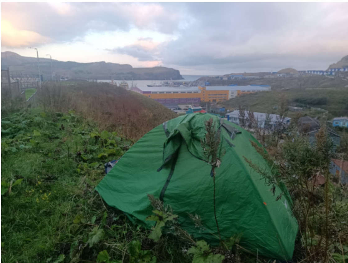
Моя палатка над главной бухтой Малокурильского

Солнце скрылось оставив после себе обеспокоенный свет. В сердце мягко стучало – «Я на Шикотане». До этого мне лишь раз пришлось бывать в его гавани, только даже не пришлось сойти на его берег ни на шаг.