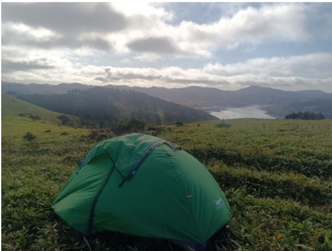
Палатку поставил на низкий бамбук на фоне поселка

Палатку поставил недалеко, у дорожки, прямо на низкий бамбук, под ковром которого оказалась ямка, заставляющая меня спать в своеобразном, цирковом положении. Было лень передвигать палатку, да и усталость действовала усыпляюще настолько, что мне это не мешало. И лишь чувство тревоги за открытую местность немного толкало в сердце. У моря всегда есть риск очень быстро поймать в паруса ветер и страдать от его попыток разорвать палатку. Мне повезло, ветер хоть и поднялся, однако не харрикейн. Ложка выпала из опустевшего ведерка мороженого. Утро пришло без опозданий.