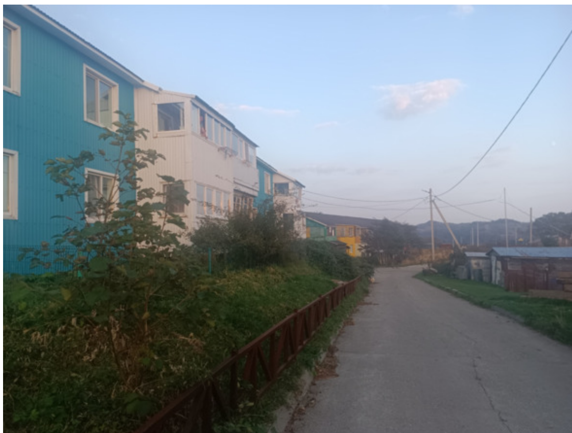
Дома довольства и замечательных фасадов. И прекрасная бетонка

Слева от меня проплыл детский садик, справа, внизу стояла увесистая школа, а впереди дорога превратилась в прекрасную «бетонку» вдоль которой расположились двухэтажные дома по правой части. Первая из них вызвала отчасти ужас, от части сожаление. Она стояла пустыми глазницами окон, лишь немногие из них сияли стеклами проживания. На другой стороне дома торчали редкие две машины. Все указывало на низкую плотность жителей в его пенатах. Следующие же два дома светились довольством и замечательным фасадом.