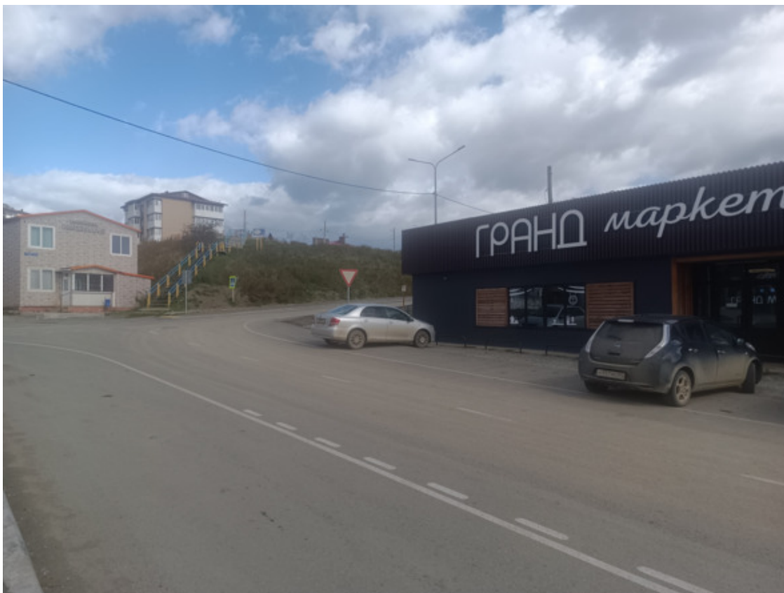
Магазин и гостиница – близкие соседи

Путь на верха первое время шел через поселок. Воняло. Огромный рыбный комбинат Верховского (местного олигарха), едва ли не самый большой в мире, распространял вокруг вонь. В основном рыбная, куда вклинивались и запахи многочисленных удобрений птиц. Чайками были облеплены все крыши.