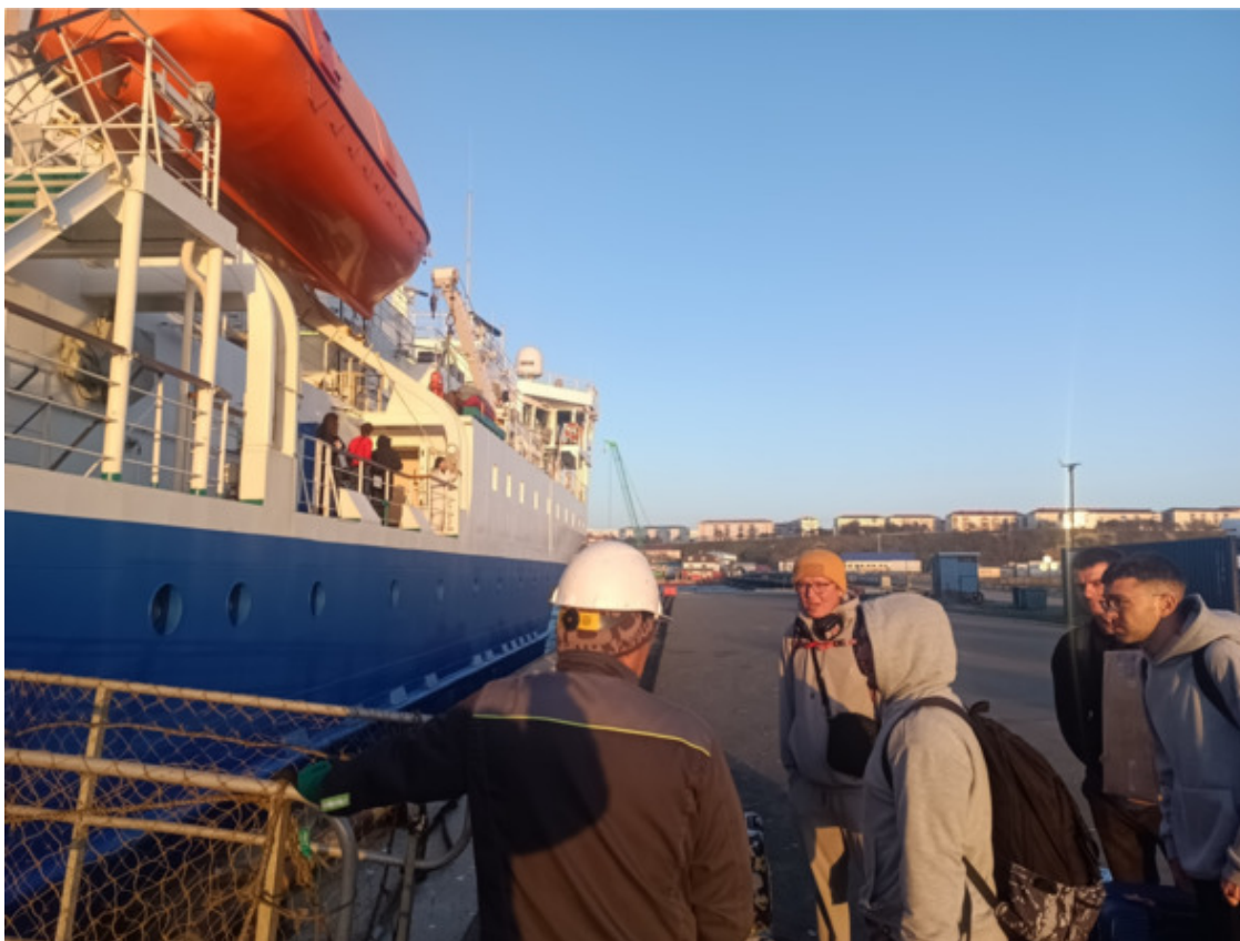
Фотографироваться на пирсе было запрещено

«Павел Леонов» принял всех в железные внутренности, и тут хотелось бы сказать о некоторых особенностях путешествия по Тихому океану на подобных суденышках. Почти постоянно вас будет сопровождать качка. Волнение в океане всегда, оно лишь отличается интенсивностью, так что заранее перед поездкой тренируйте аппарат отвечающий за противодействие качке. Есть и медикаментозные средства бороться с ней, однако эффективность варьируется и сложно сказать какой препарат наиболее силен – драмина ли, японские ли таблетки. Хотя в среднем я вывел, что японские средства будут поинтересней. Продаются в любом японском магазине Южно-Сахалинска.