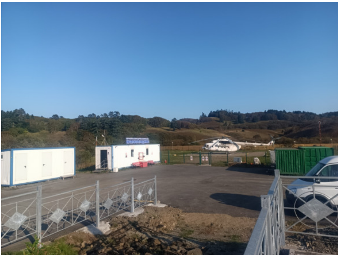
Вертолетные ворота Шикотана

Сейчас же меня мало заботил асфальт, виды шикотанских берегов и вертолетное сообщение. Я настойчиво искал то ли столовую, то ли кафе. Заботливые местные граждане уверено отправили в магазин «ГранД». Это своеобразный гибрид продуктового супермаркета в одном крыле и хозяйственного в другом. Заходим и сразу налево. У большого панорамного окна изящные доски, изображающие столики, и высокие табуретки – это обеденная зала, где маняще торчали розетки, важный элемент для походного люда, затрагивающей сердца. Все очень прилично, не подумайте.