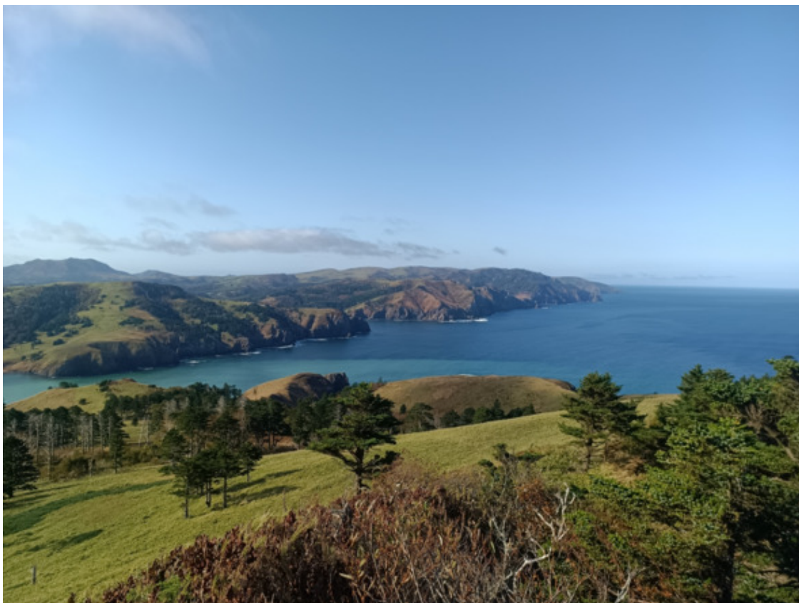
Вид с обзорной точки другой стороны бухты Краб

Рюкзак бросил где-то там и побежал к самой высокой точке. Справа обнажился провал с невероятными скалами и невидимым ручьем в ельнике. Все было фантастически окружено горно-каменистыми пейзажами, темным лесом и отдельными скалами. Зрелище для неподготовленных убийственно красивое.