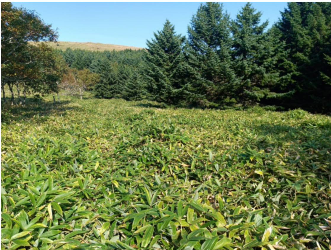
Господство бамбука и ели

Обратно спускался уже по тропе, в темноватом лесу темнохвоя. Везде росли ели и бамбук, иногда пробивалась березка или одиночная Аралия высокая, с края тропы слегка показался брусничник. В целом все же господствовали два вида – ель и бамбук.