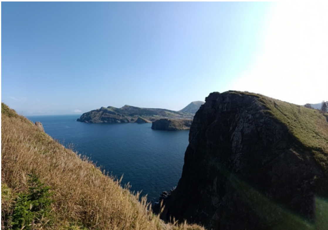
Один из зубов Трезуба на фоне поселка

Огромные провалы в бесконечную пустоту пугали, а лоснящиеся белые полосы прибоя внизу вызывали восхищение и трепет. Все это нужно видеть, словами грандиозность замысла Природы передать невозможно, здесь лишь можно надеяться на правдивость слов автора утверждающего, что оно того стоит, чтобы увидеть и почувствовать.