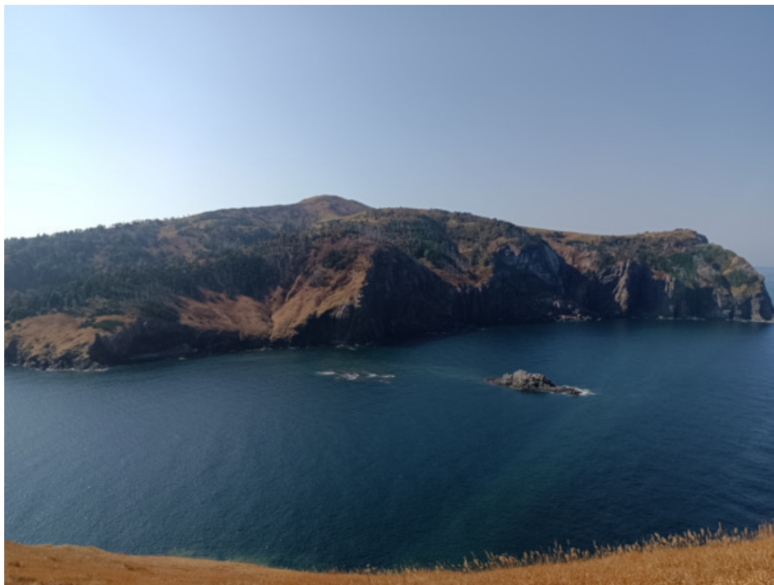
открылась бухта Отрадная

Солнце в этот день (3 октября) было злым и теплым. Ни одна туча не смела прикрыть его и вдали от моря было жарковато. В будущих скитаниях по острову с погодой везло реже, и хорошо что я об этом не догадывался.