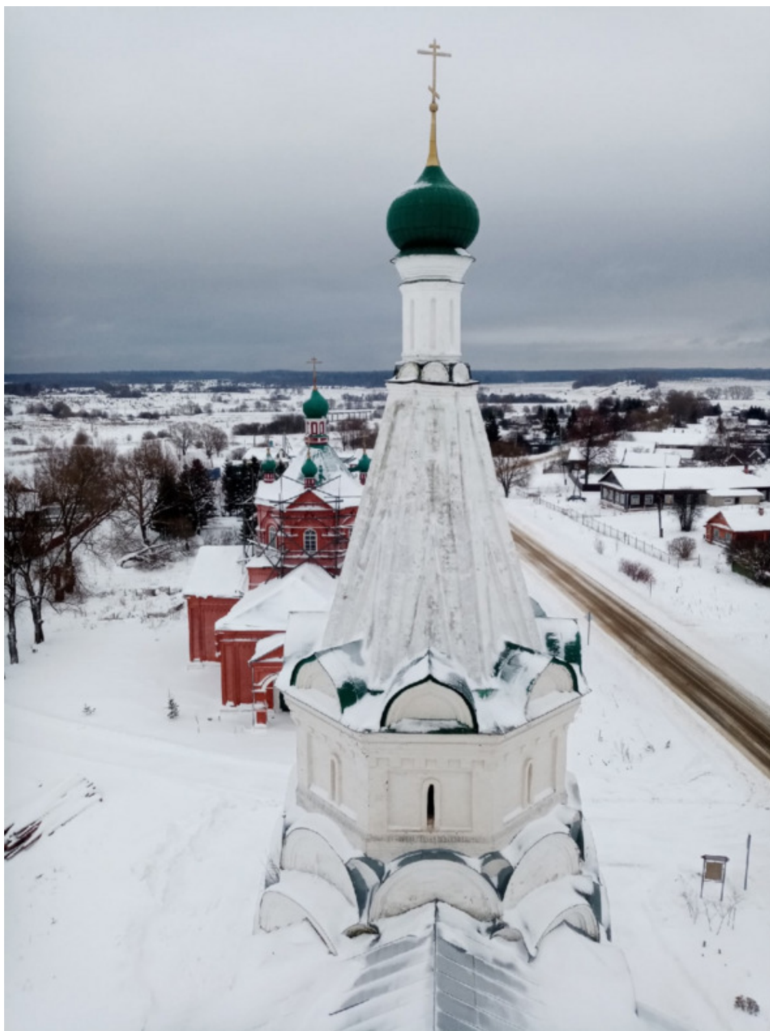
Никитский храм в с. Елизарово на территории вотчины бояр Басмановых. Вид на старый шатровый храм XVI века с колокольни (звонницы), 1.01.2022 г. Все фото, использованные в книге, принадлежат автору.