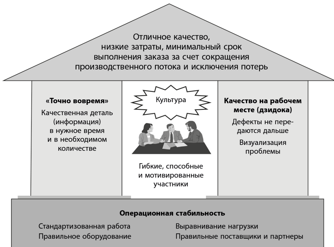
Рис. А.1. Производственная система Toyota (TPS)

Идея колонны «качество на рабочем месте» приписывается Сакити Тоёде, который изобрел первый полностью автоматизированный ткацкий станок. Одной из многих его новаций было устройство, которое автоматически останавливало станок при обрыве нити. Затем подавался сигнал о проблеме, что позволяло оператору максимально быстро ее устранить. Метод работы, когда машина сама видит проблему, он назвал словом «дзидока». В наши дни мы называем это встраиванием качества. Идея концепции проста – не позволить дефектному элементу покинуть рабочее место. Вторая колонна – идея «точно вовремя» – принадлежит Кийтиро Тоёде, основателю компании. Он считал, что Toyota должна «избавиться от лишнего во всех рабочих процессах» и следовать принципам JIT (англ. just-in-time – «точно вовремя». – Прим. ред.) – в то время это было необходимо хотя бы для того, чтобы избежать банкротства. Кийтиро разработал соответствующие детальные процессы. В фундаменте этого строения лежит стабильная деятельность, то есть отрегулированный поток работы. Он необходим для реализации идеи «точно вовремя» (принципы 2, 3 и 4) и решения проблем в момент их возникновения (принцип 6). А в центре этих процессов стоят гибкие, умелые и мотивированные люди, посвятившие себя идее непрерывного совершенствования (принципы 9, 10 и 11).