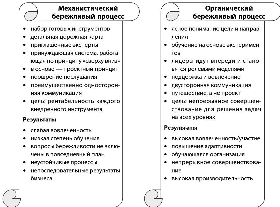
Рис. А.2. Выводы участников мастер-класса о механистической и органической организации

Когда я спрашиваю присутствующих, какой подход им импонирует и какой они считают наиболее результативным, большинство отдают свои голоса за органический, как более выигрышный в перспективе. Но для быстрых результатов они предпочитают механистический. К счастью, всегда находится тот, кто предлагает не делать между ними выбора, а попытаться научиться совмещать элементы обоих. Тогда я приступаю к описанию поощряющей бюрократии. С каждой моей фразой глаза аудитории загораются все сильнее. Они начинают кивать в такт моим словам и в итоге признаются, что именно к этому стремятся.