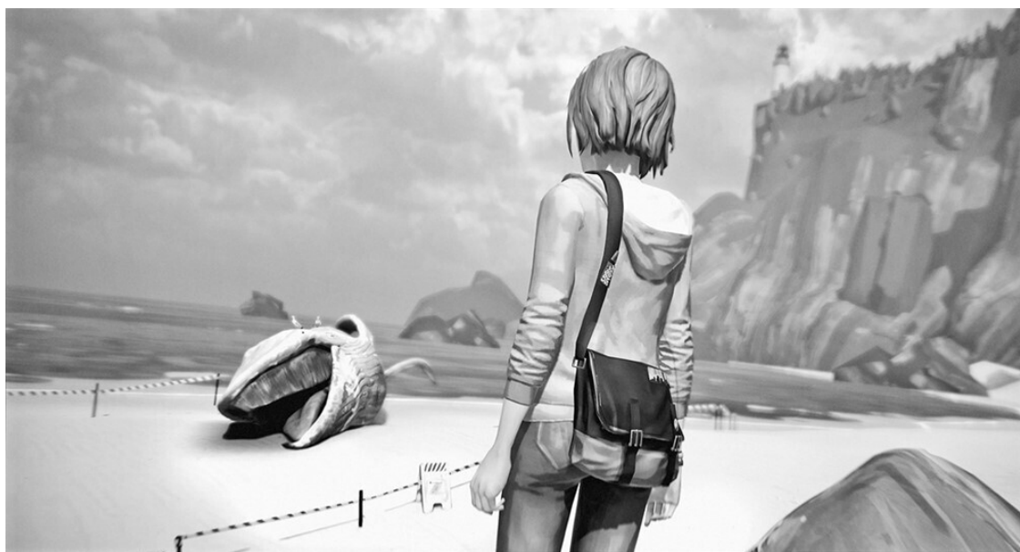
Life is Strange, Dontnod Entertainment, 2015

Идея, что видеоигры являются искусством, не нова, но до сих пор вызывает немало дискуссий, упирающихся в конечном итоге в то, что определить, что такое «искусство», не так-то просто. В конце концов, считается что-то искусством или нет, зависит от социальных конвенций, а не от объективных свойств. Ничто, даже «Мона Лиза», не будет искусством, если мы, как общество, не договоримся считать её таковым. По этой же логике в рамках нашей книги мы договоримся, что будем смотреть на видеоигры в первую очередь как на искусство, способ восприятия и изображения реальности, прекрасно понимая, что это далеко не единственный и не исчерпывающий взгляд.