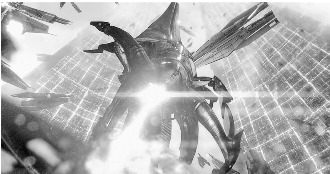
Mass Effect Legendary Edition, Bioware , 2021.

Нам совершенно не важна информативная часть этого текста. По большому счёту, даже сам принцип, продвигаемый Ваасом, менее значим, чем единое впечатление, которое производит текст: перед нами – не положительный персонаж, а опасный и агрессивный безумец. И такое использование текста пронизывает всю видеоигровую индустрию.