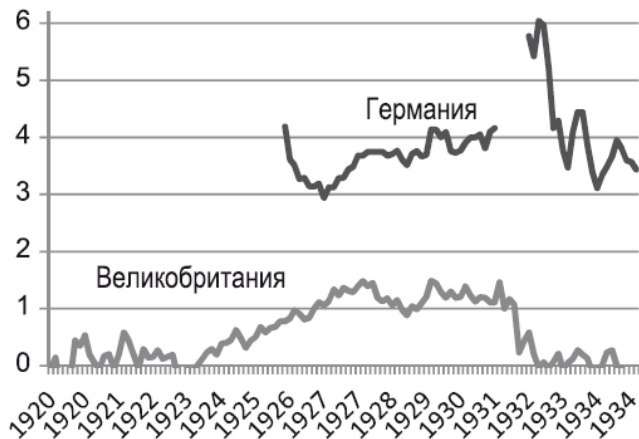
Гр. 3. Разница в процентных ставках по отношению к США, % 272

Иностранных инвесторов привлекали и дешевые немецкие активы: с началом плана Дауэрса американские фирмы стали владельцами и совладельцами многих немецких компаний: «Опель», электро- и радифирм «Лоренц», «Микст-Генест», угольного концерна «Стиннес», нефтяных и химических концернов «Дойче-американише петролеум» и «ИГ Фарбениндустри», объединенного «Стального треста» и т. д. 270 Если бы «деньги продолжали литься рекой, – приходил к выводу Препарата, – то Германия в скором времени превратилась бы в настоящую колонию Уолл-стрит» 271 .