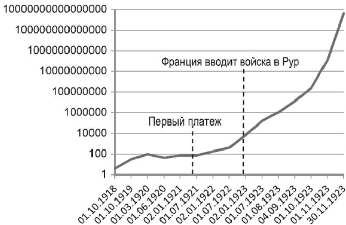
Гр. 2. Курс бумажной марки по отношению к доллару 225

Гиперинфляция привела к резкому снижению заработной платы. Если до войны лучше германского рабочего оплачивался только американский, то в апреле 1922 г., как подсчитал английский статистик Дж. Гилтон: чтобы купить один и тот же набор продуктов, американскому каменщику нужно было работать один час, английскому – три, французскому – пять, бельгийскому – шесть, а немецкому – семь часов с четвертью. По отношению к 1913 г. реальная заработная плата в апреле 1922 г. составляла – 72 %, в октябре – 55 %, в июне 1923–48 % 226 .