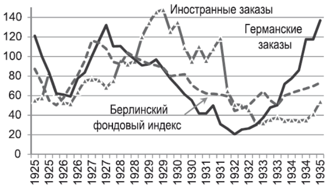
Гр. 4. Заказы германской машиностроительной промышленности и индекс Берлинского фондового рынка, по кварталам, 1928 г. – 100 % 274

Перспективы неизбежного краха «кредитной пирамиды» забеспокоили президента Рейхсбанка Шахта уже с начала 1926 г. Тогда Шахт попытался установить контроль над частными заимствованиями за рубежом, но безуспешно. Когда он пытался наладить финансовую дисциплину, правительство в ответ наоборот вводило налоговые привилегии для иностранных кредитов, правительству были необходимы средства для финансирования экономики. Проблема Шахта, в свою очередь, заключалась в том, что при росте долговой нагрузке, доля накоплений в Германии оставалась ничтожной, а финансовые резервы практически отсутствовали. Платить было нечем. Почувствовав угрозу J. P. Morgan, а за