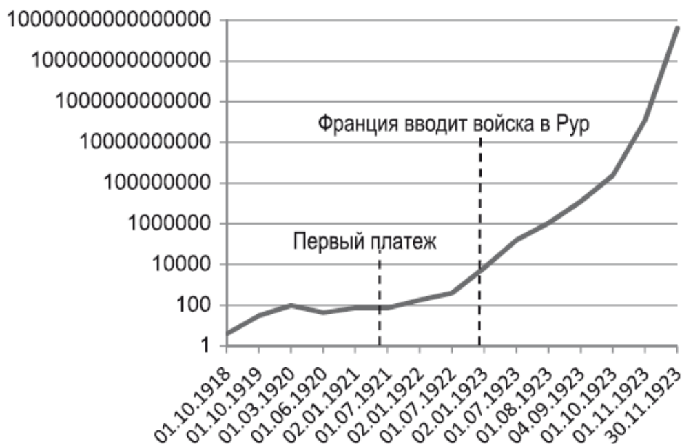
Гр. 2. Курс бумажной марки по отношению к доллару 225