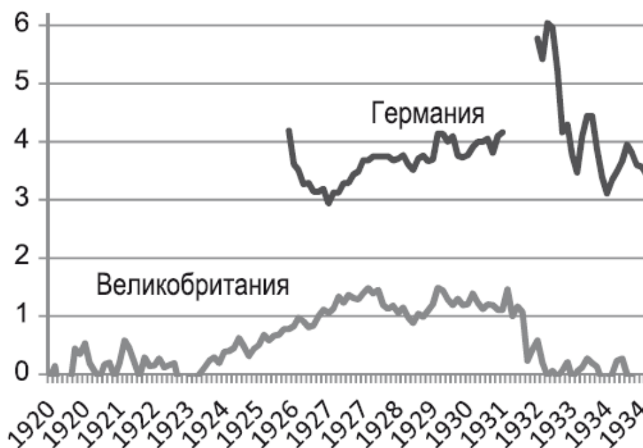
Гр. 3. Разница в процентных ставках по отношению к США, % 272