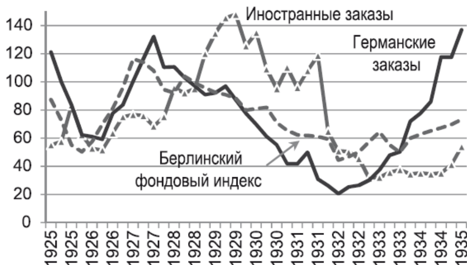
Гр. 4. Заказы германской машиностроительной промышленности и индекс Берлинского фондового рынка, по кварталам, 1928 г. – 100 % 274

Перспективы неизбежного краха «кредитной пирамиды» забеспокоили президента Рейхсбанка Шахта уже с начала 1926 г. Тогда Шахт попытался установить контроль над частными заимствованиями за рубежом, но безуспешно. Когда он пытался наладить финансовую дисциплину, правительство в ответ наоборот вводило налоговые привилегии для иностранных кредитов, правительству были необходимы средства для финансирования экономики. Проблема Шахта, в свою очередь, заключалась в том, что при росте долговой нагрузке, доля накопленных в Германии оставалась ничтожной, а финансовые резервы практически отсутствовали. Платить было нечем. Почувствовав угрозу J. P. Morgan, а за ним в конце 1927 г. и другие американские банки снизили кредитный рейтинг Германии.