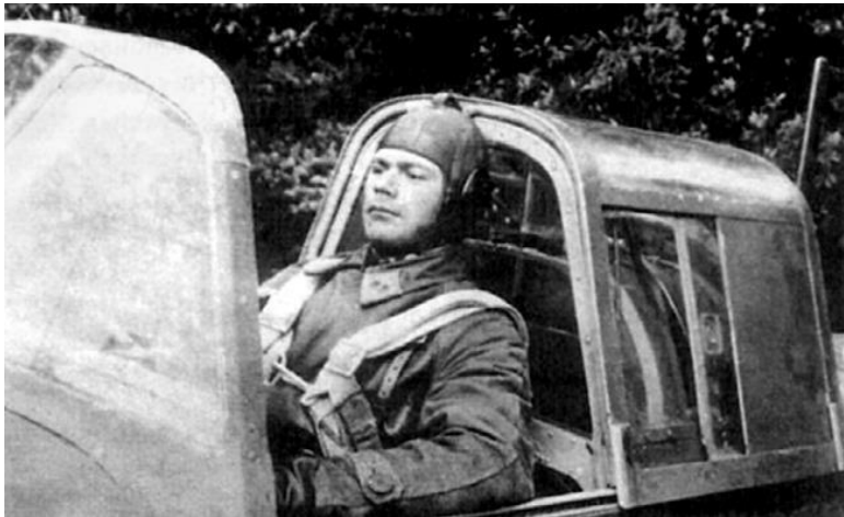
Командир эскадрильи 826-го штурмового авиаполка