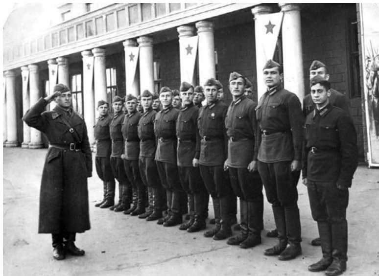
Курсанты Пермской авиашколы им. В.М. Молотова