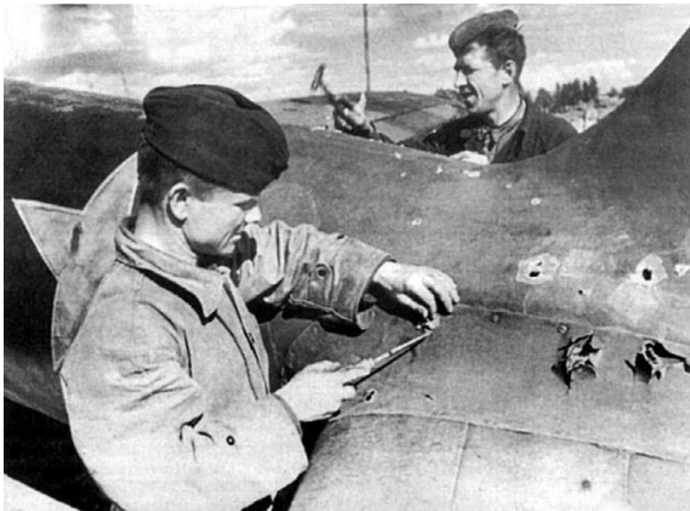
Устранение пробоин от осколков зенитных снарядов