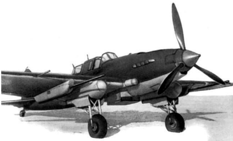
Штурмовик Ил-2, вид спереди