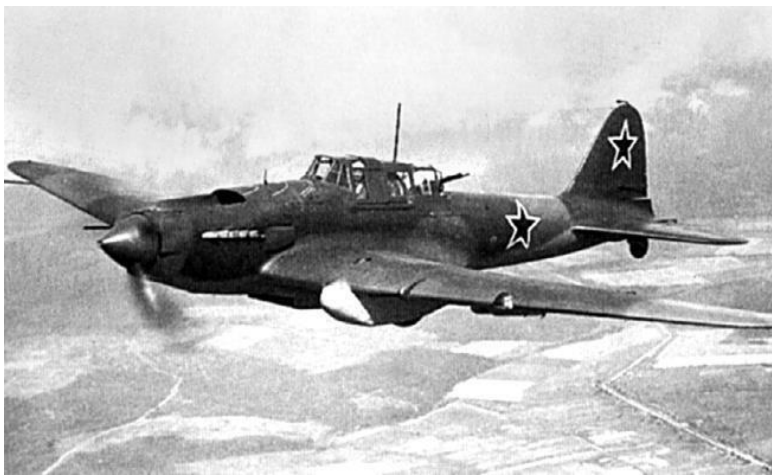
Ил-2 в воздухе