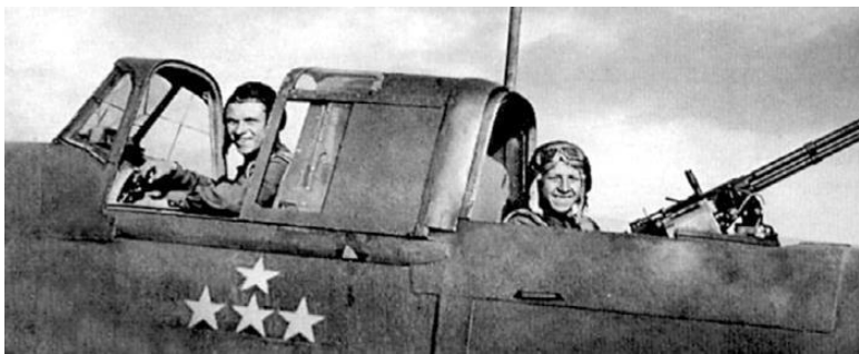
Боевой экипаж штурмовика Ил-2 – летчик и стрелок-радист