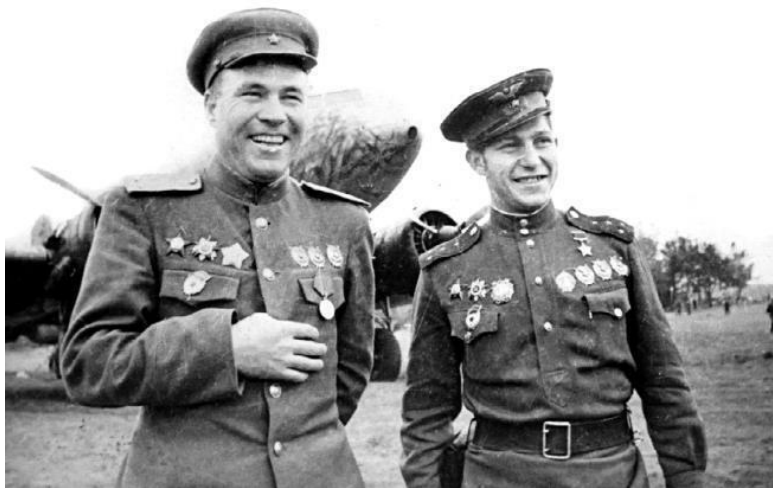
Герой Советского Союза гвардии капитан Александр Ильич Миронов (справа)