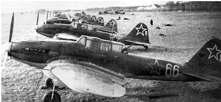
Ил-2 на полевом аэродроме