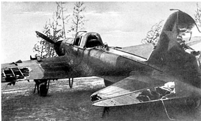
Боевые повреждения Ил-2