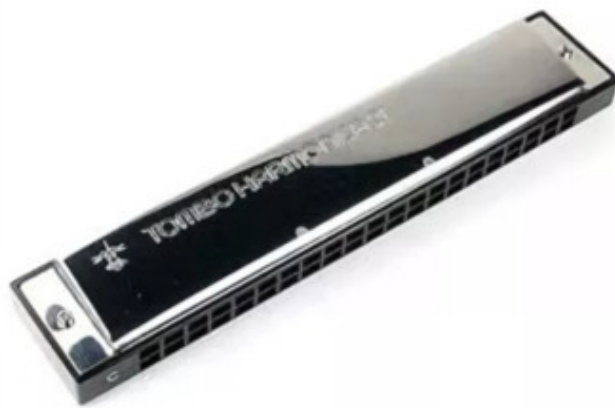
Рис.3 Губная гармошка Тремоло

В этой книге для дальнейшего рассмотрения мы выбираем Губную Гармошку Тремоло.