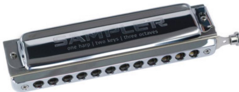
Рис. 2 Хроматическая губная гармошка

Хроматические губные гармошки, оснащены слайдером, позволяющим играть все ноты, включая диезы и бемоли. Они идеально подходят для джаза и классики.