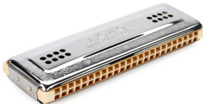
Рис. 4 Двухсторонняя Губная Гармошка Тремоло

Надо сказать, что Губные Гармошки Тремоло бывают двухсторонними, как две отдельные губные гармошки, скрепленные задними сторонами.