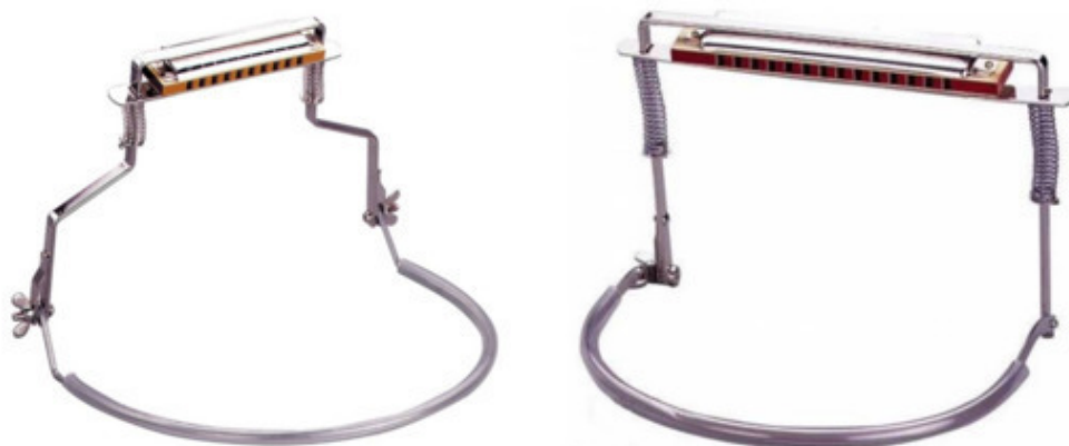
Рис. 6 Холдер короткий и длинный

Чтобы освободить руки гитариста от необходимости держать губную гармошку придумали специальное устройство – холдер (holder) или по-русски – держатель.