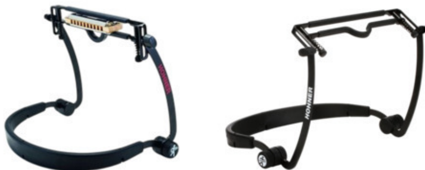
Рис. 7 Холдер с дополнительной регулировкой

Это умеют делать более продвинутые холдеры, но и стоят они значительно дороже.