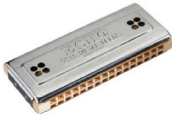
Рис. 5 Уменьшенная двухсторонняя Губная Гармошка Тремолю