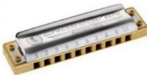
Рис.1 Блюзовая губная гармошка

Диатоническая губная гармошка – самый распространённый тип, подходящий для большинства музыкальных стилей, особенно блюза и фолка.