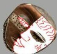
Здесь был Вася