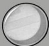
Здесь был Вася