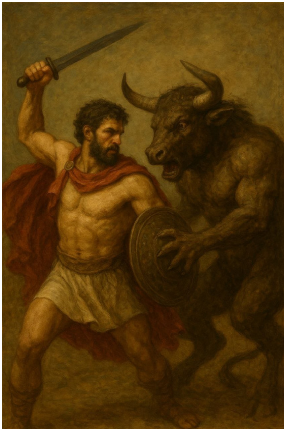
10. Бой Тесея с Минотавром.