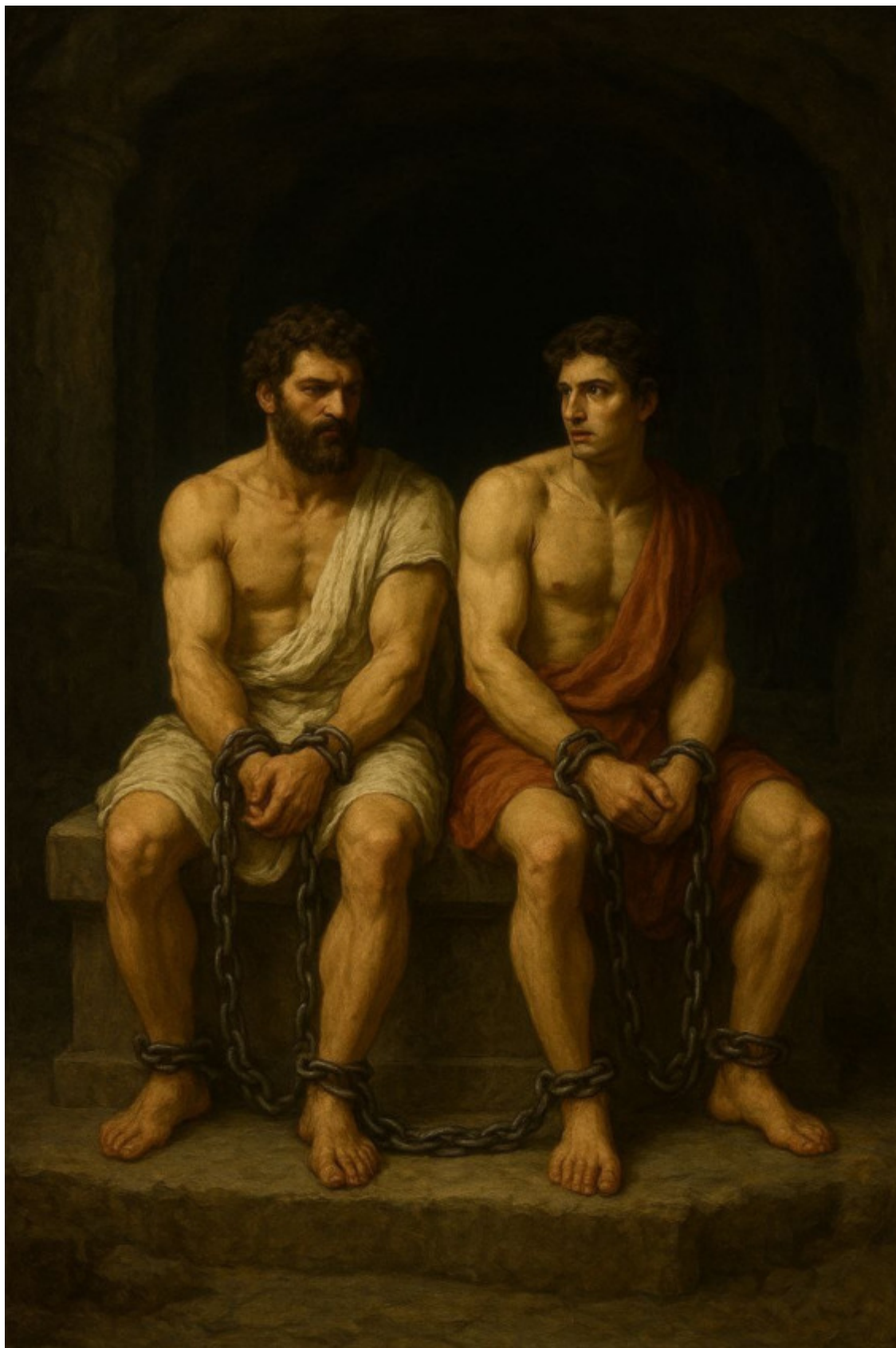
16. Тесей с Перифоем прикованы на волшебной скамье.