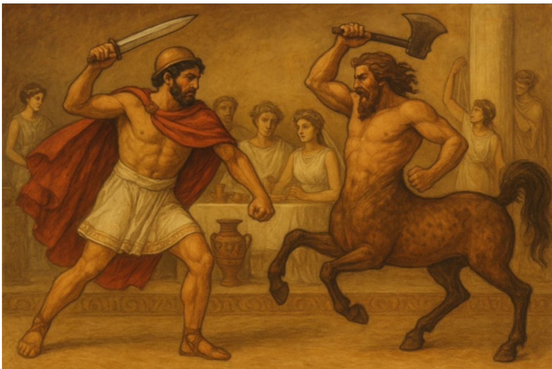
14. Бой лапифа с кентавром.

Копьями и топорами В основном кентавры бьются. С алкогольными парами На людей они несутся.