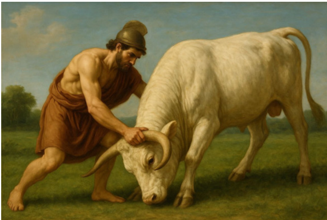
7. Тесей нагибает голову Марафонскому быку.

Тесей за рога хватает, Голову нагнул быку. И к земле все прижимает, Тут сдаётся бык врагу.