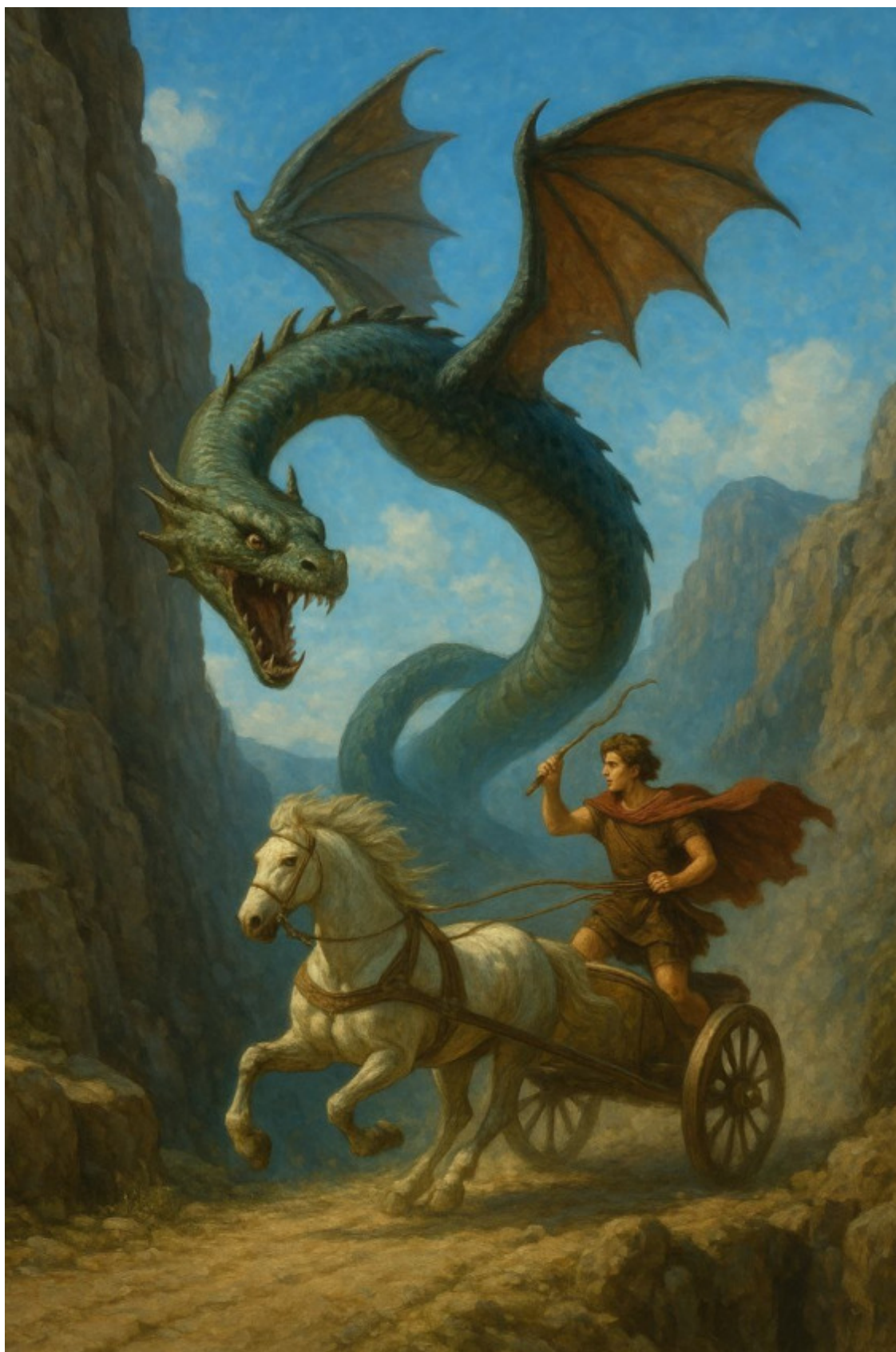
15. Нападение морского змея на Ипполита.