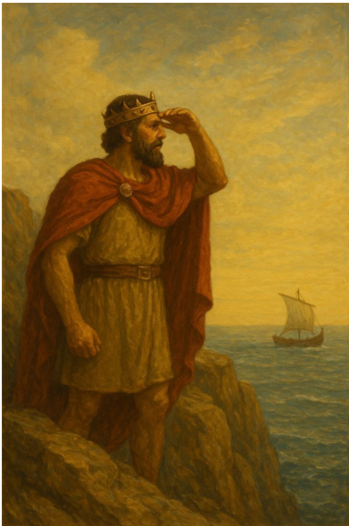
11. Царь Эгей на скале ожидает прибытия Тесея.