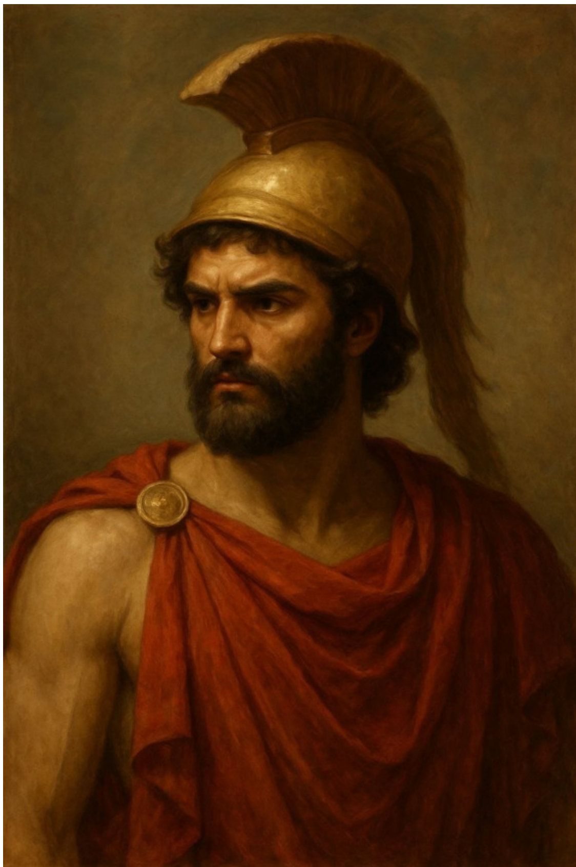
1. Древнегреческий герой Тесей.