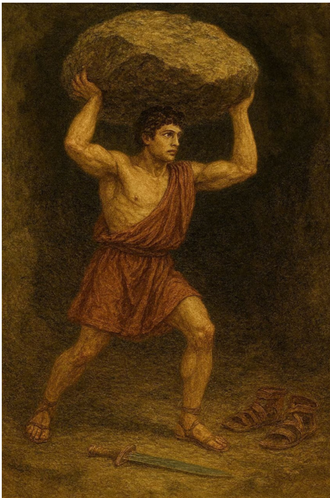
3. Тесей нашел меч и сандалии своего отца.