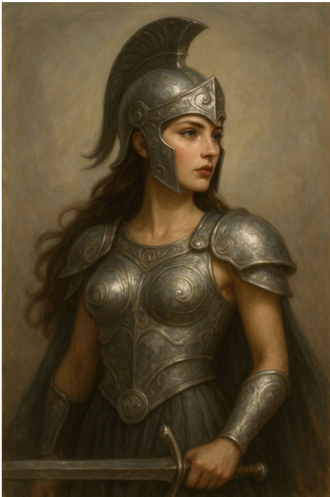
12. Царица амазонок Антиопа.