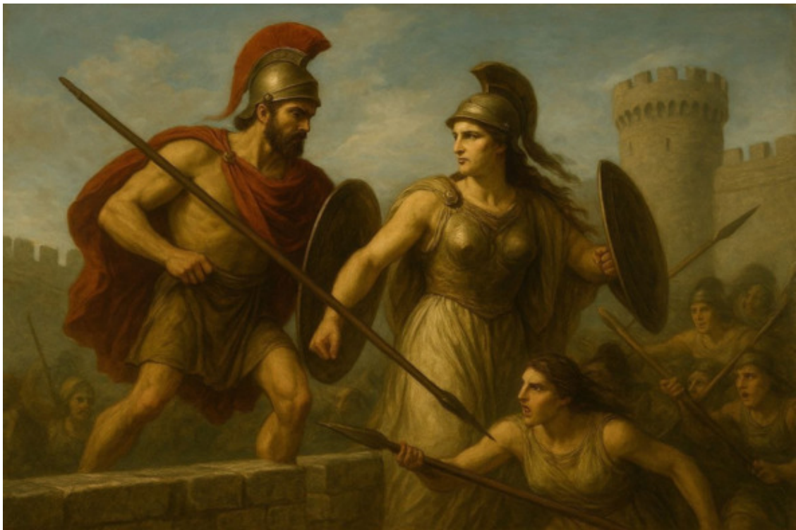
13. Антиопа рядом с мужем защищает Афины.

Антиопа рядом с мужем Защищала стольный град. Каждый воин очень нужен, Когда бьются все подряд.