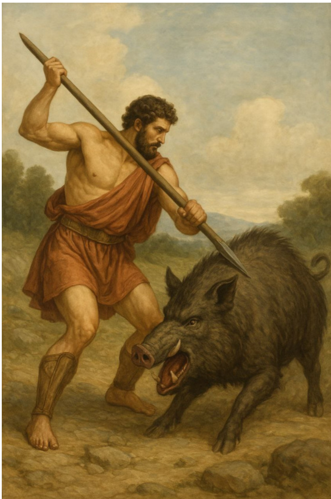
4. Тесей сражается с диким вепрем.