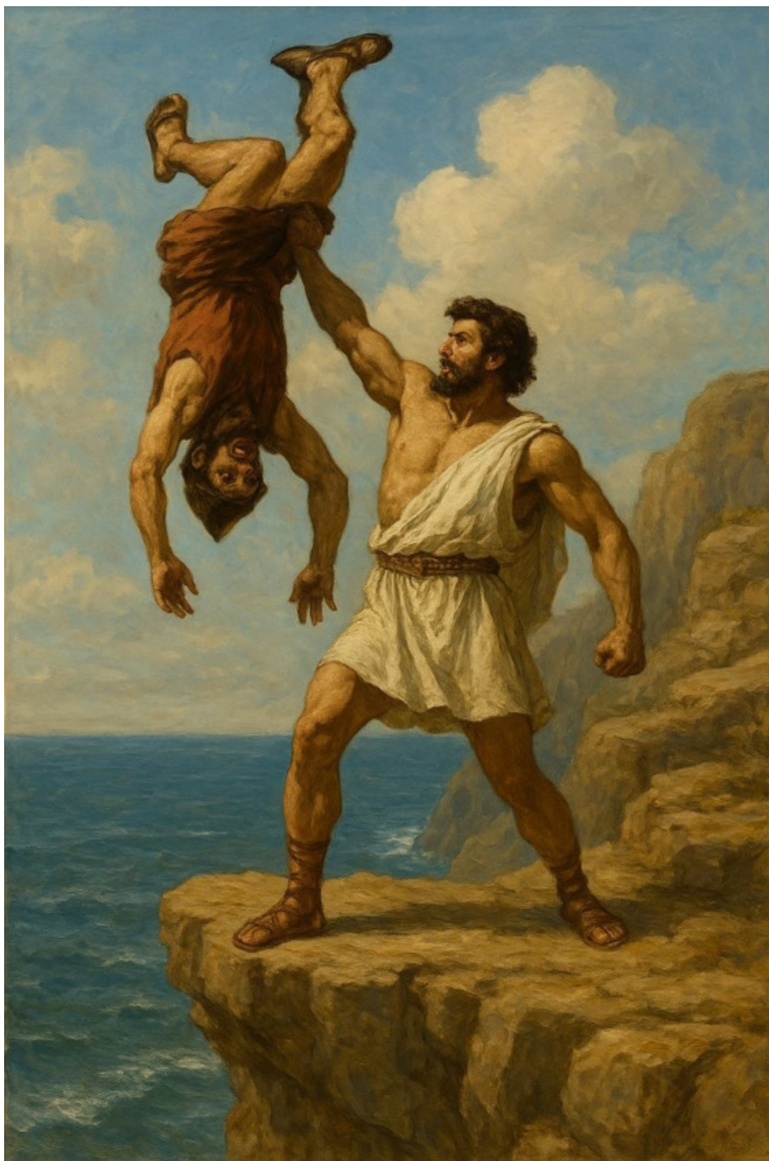
5. Тесей кидает Скирона в бездну.