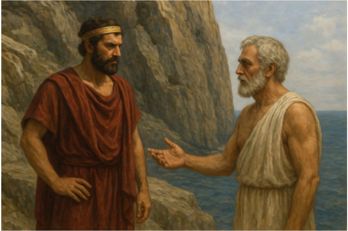
17. Ликомед заманивает Тесея на скалу.