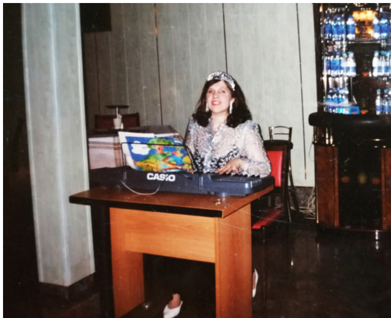
Концерт в санатории «Сокольники» в Москве. Пою и ак-

тоже похвалил меня после выступления, сказав, что я пою его вокальный цикл «Плач гитары» (на стихи Федерико Гарсиа Лорки, с романсом «Кармен» и явственно проступающими в музыке испанскими мотивами) лучше, чем знаменитая Зара Долуханова! Интересно, что профессиональные музыканты, которых я встречала по жизни, часто подбадривали меня комплиментами, даря вдохновение для продолжения музыкального пути.