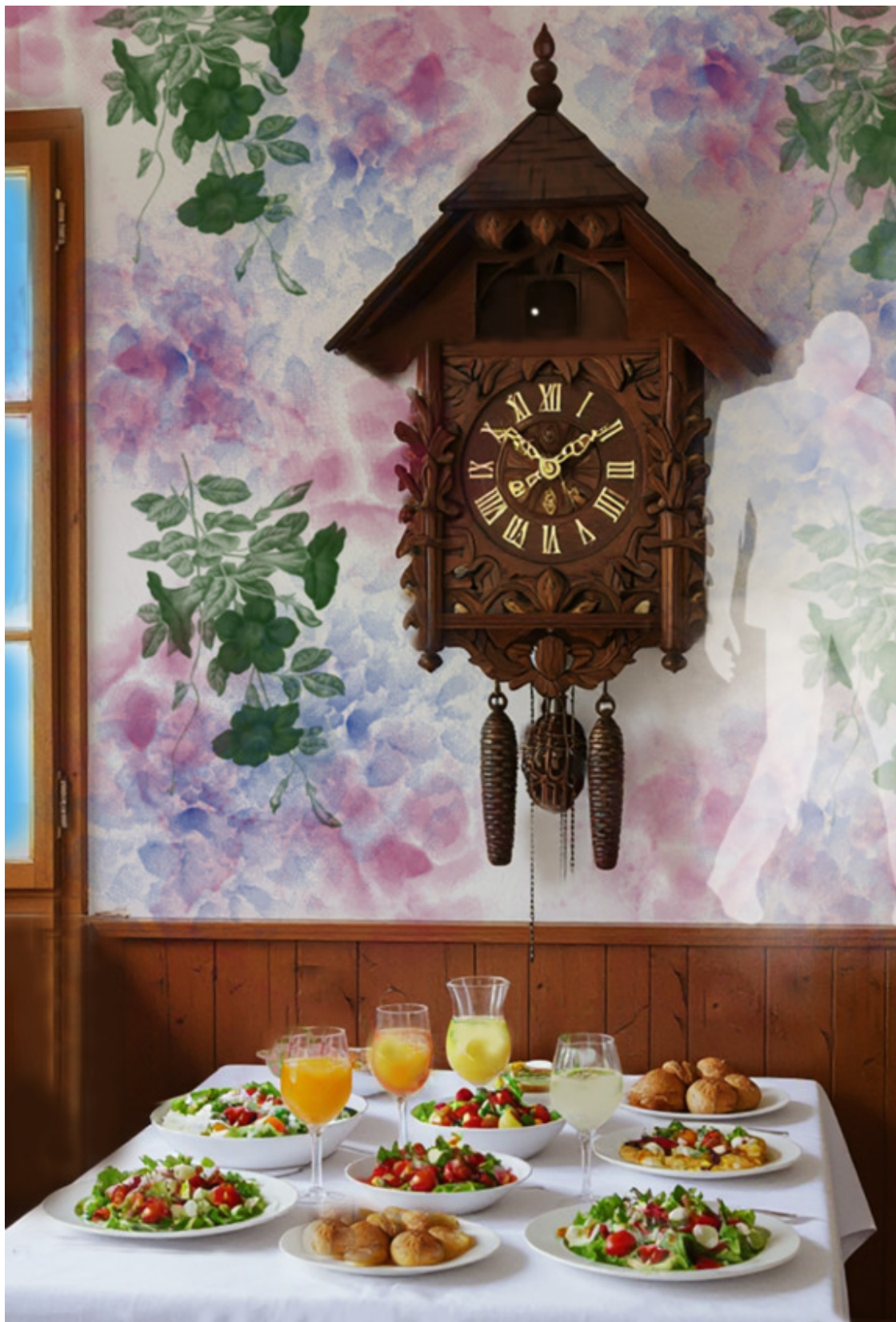
Гошины часы, призрак и поминальная трапеза. Рисунок.