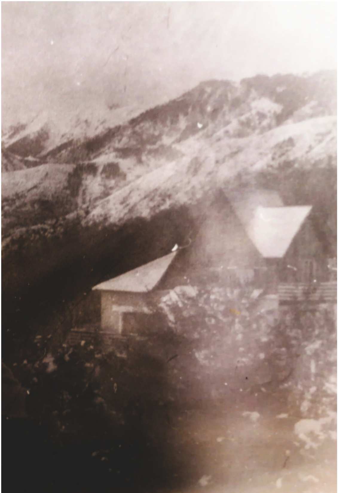
Коттеджи «Тау-Тургеня» в горах Казахстана (фото из семейного архива).

Необходимо заметить, что во время нашего отдыха на территории Дома композиторов присутствовало очень мало людей. Нас, как я уже говорила, было трое; через один коттедж жила дочь композитора, которая уже завершала свой отдых и позднее уехала. В небольшом