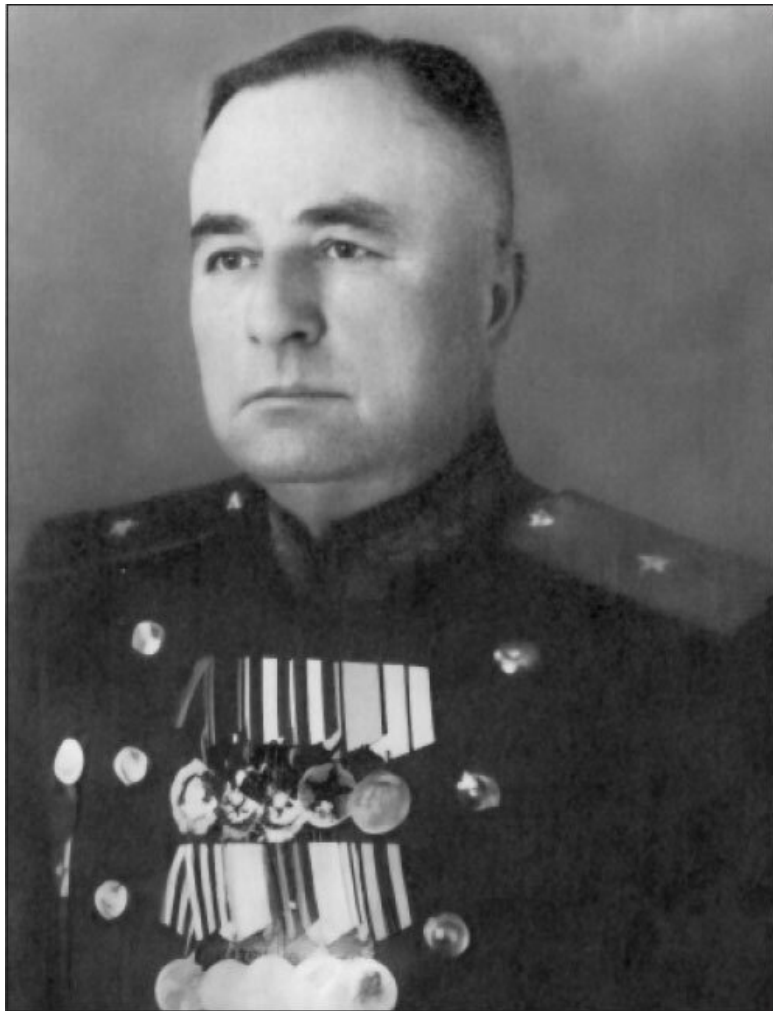
Первый командир диверсионно-разведывательного пункта