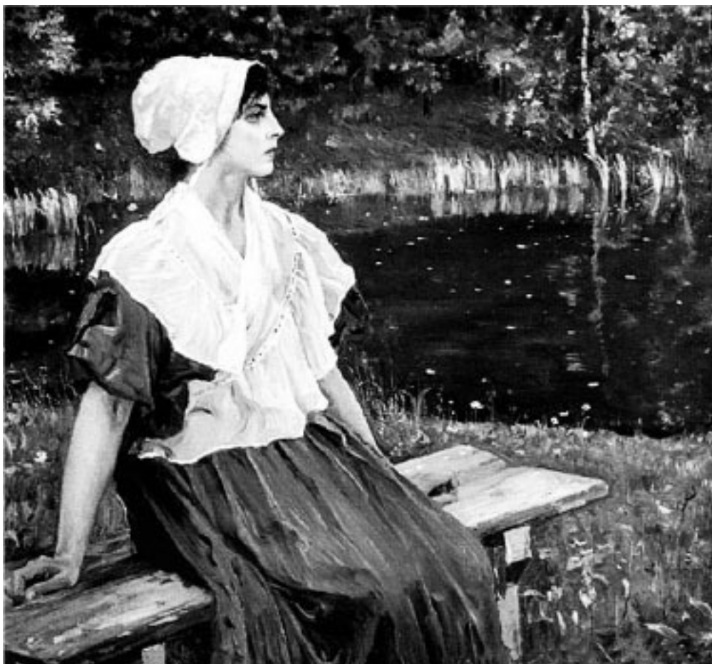
М. В. Нестеров. Девушка у пруда. 1923 г.

В обращении к Федерации женских клубов в Америке Н. К. Рерих писал: «Когда в доме трудно, тогда обращаются к женщине. Когда более не помогают расчёты и вычисления, когда вражда и взаимное разрушение достигают пределов, тогда приходят к женщине. Когда злые силы одолевают, тогда призывают женщину. Когда расчётливый разум оказывается бессильным, тогда вспоминают о женском сердце. Истинно, когда злоба измельчает решение разума, только сердце находит спасительные исходы. А где же то сердце, которое заменит сердце женское? Где же то мужество сердечного огня, которое сравнится с мужеством женщины у края безысходности? Какая же рука заменит успокоительное прикосновение убедительности женского сердца? И какой же глаз, впитав всю боль страдания, ответит и самоотверженно, и во благо? Издревле венки давались героям и были принадлежностью женщин» ( Рерих Н. К. Твердыня пламенная. Нью-Йорк, 1932. С. 311 ).