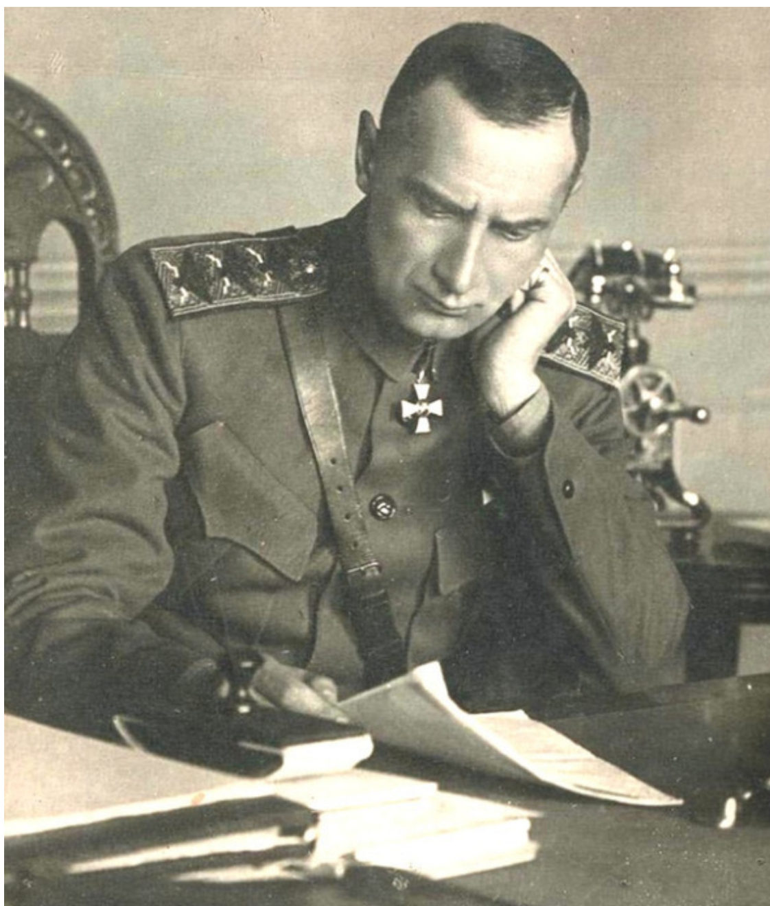
Первые зерна мифа: слухи и пропаганда.

В руках Колчака оказались не только золотые запасы Российской империи, которые были эвакуированы из Петрограда в Казань, но и значительные объемы золота, добываемого в Сибири. Эти запасы, по разным оценкам, могли составлять сотни тонн. Они стали для Колчака и его правительства жизненно важным ресурсом, который должен был обеспечить победу в войне и восстановление страны.