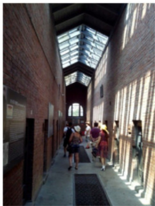
В японской части тюрьмы