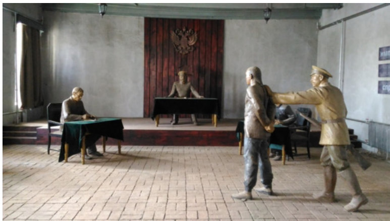
Камера мирового судьи в арестном доме

С образованием на территории северной части Китая марионеточного государства «Маньчжоу-Го» здания использовались японцами как тюрьма для проведения репрессий над китайским и русским населением Маньчжурии. В подвальном помещении здания имеются комнаты пыток, инструменты, с помощью которых осуществлялись пытки, в т.ч. так называемый андреевский крест для распятия узников перед поркой. На территории тюрьмы сохранился японский станок для печатания картотеки осужденных.