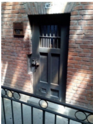
Дверь в камеру