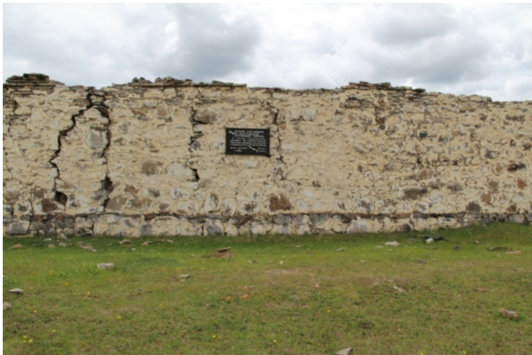
Стена Акатуйской каторжной тюрьмы