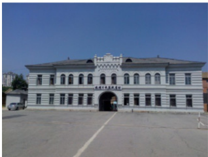
Главный административный корпус тюрьмы в Порт-Артуре