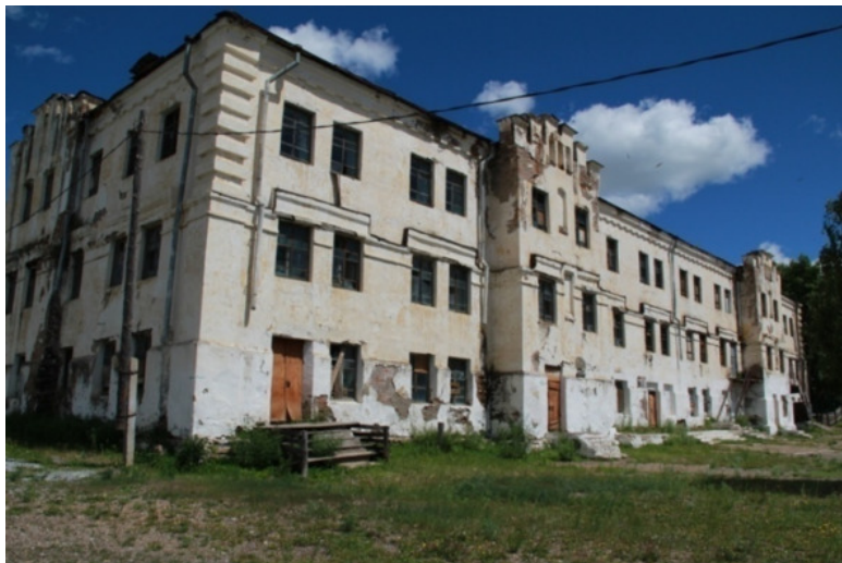
Здание Зерентуйской каторжной тюрьмы

донова, Ф. Е. Каплан, Ф. М. Фрумкина, в 1911 – 1913 на каторге находился Г. И. Котовский, совершивший удачный побег. Через Нерчинскую каторгу прошли пугачевцы, декабристы, участники Польского восстания 1830—1831 гг, петрашевцы, нечаевцы, ишутинцы, народники и другие революционеры, не говоря об уголовниках всех мастей.