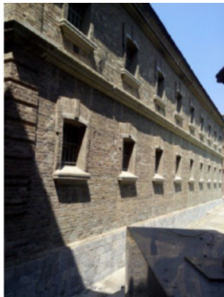
Фрагмент русского здания