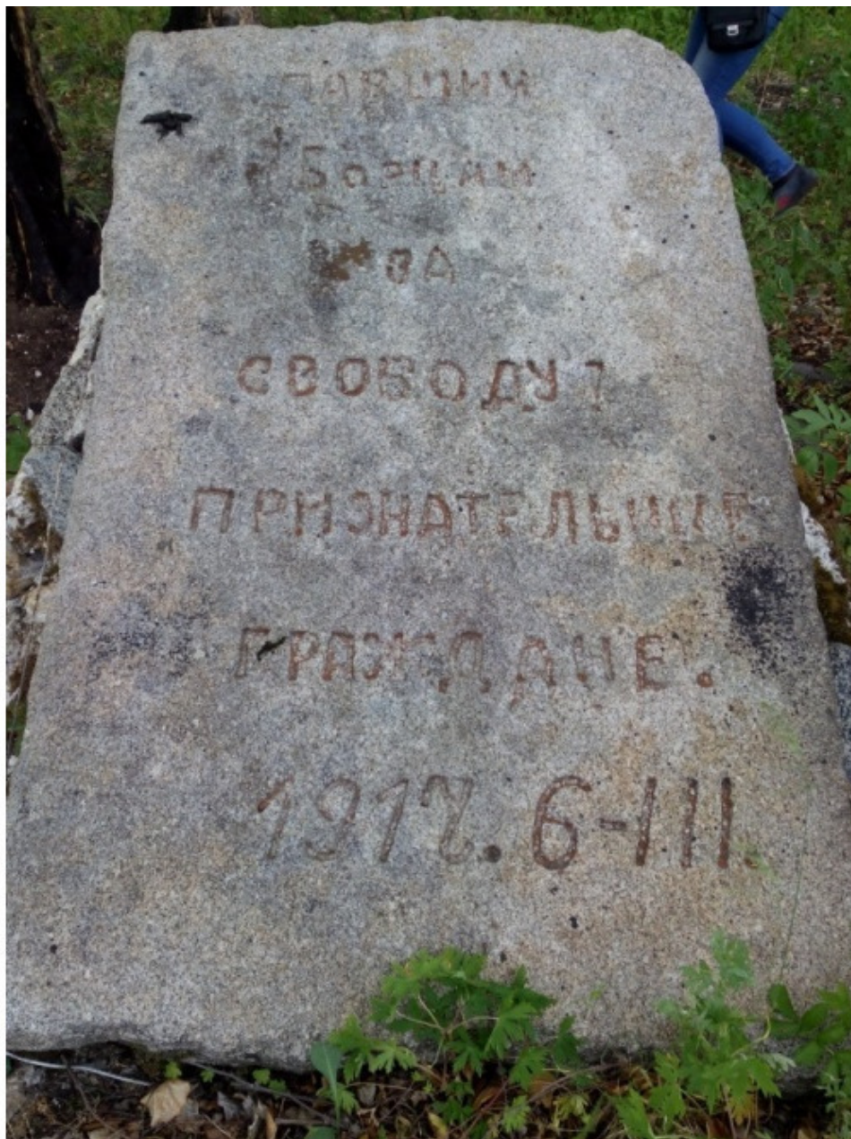
Кутомара. Плита в честь ликвидации каторги