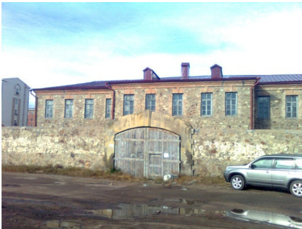
Русский арестный дом в г. Маньчжурии