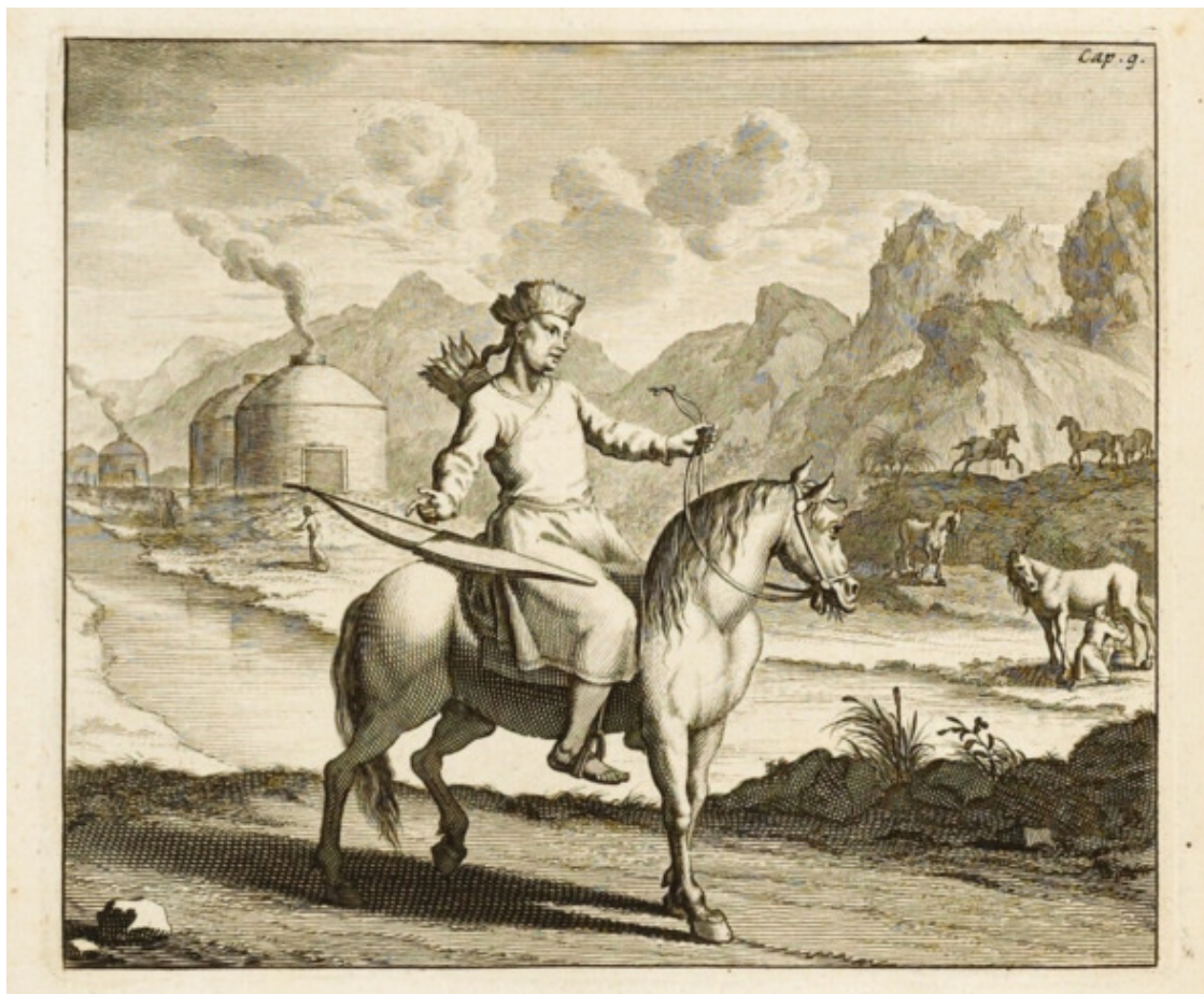
Тунгусский князец. Из книги Избранта Идеса

Известно также, что на границе конные тунгусы общались с монголами на монгольском языке без всяких затруднений.