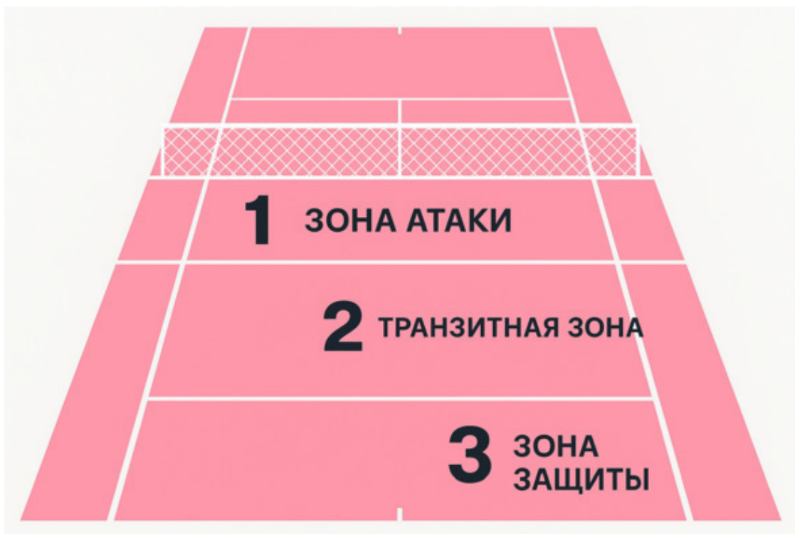
Рисунок 4. Локация игровых позиций