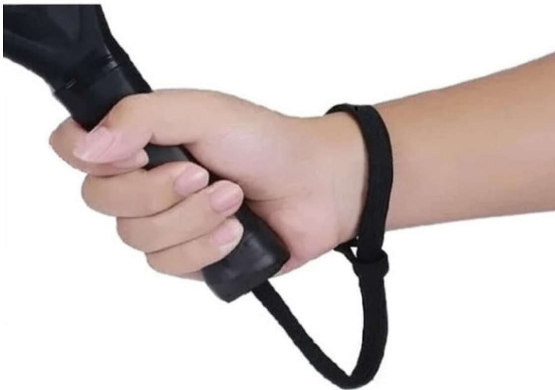
Рисунок 2. Положение шнурка на ракетке для падела во время тренировки или игры

!!! Всегда надевай шнурок на руку перед началом тренировки или игры.