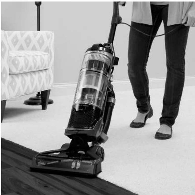
Американский пылесос.