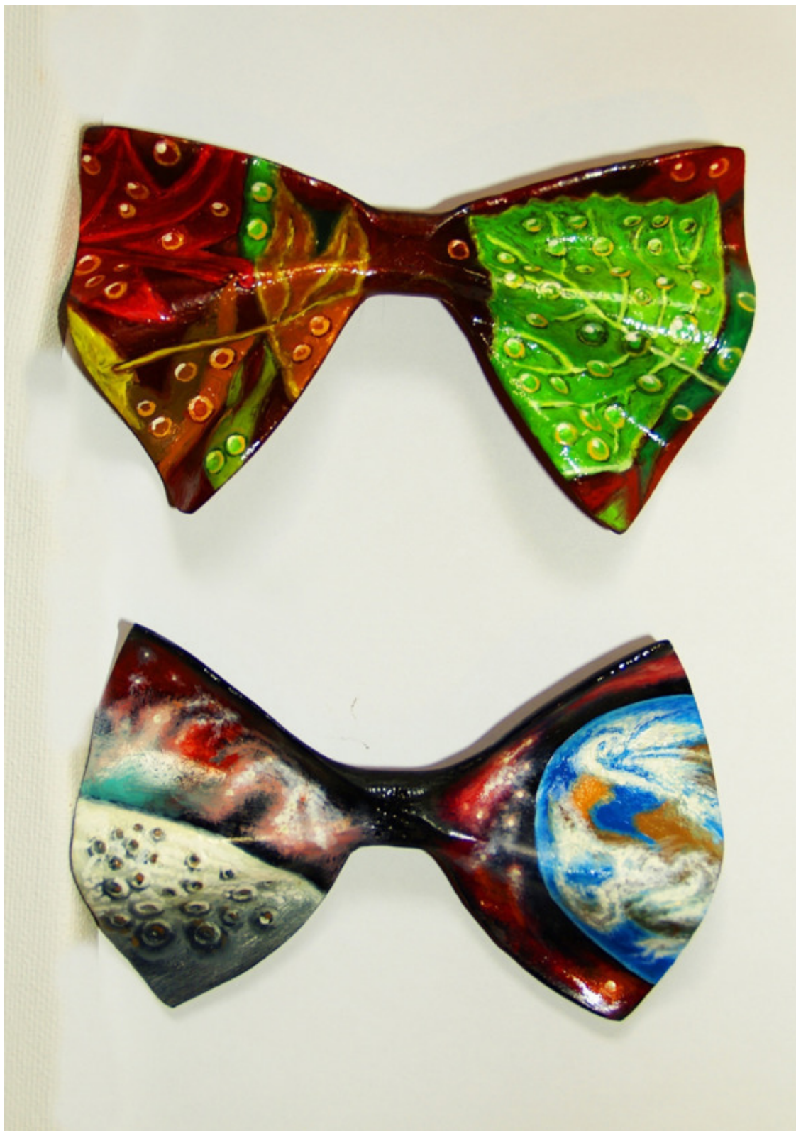
Рисунок 8. А. П. Акиндинов. Галстуки-бабочки: «Космос» и «Осень». Росписи на бабочках фирмы «VENETASH». Масло, красное дерево. 2020 – 2021.

Исследование А. Риглем орнамента в контексте конвенционализации объектов творчества позволило ученому вывести грамматические правила развития орнаментации, где самый главный принцип, как в ней существует изображение. Осуществляется перенос того, что возможно ощутить (линию, локальные цветовые пятна, симметрию, повторение), на тектонику