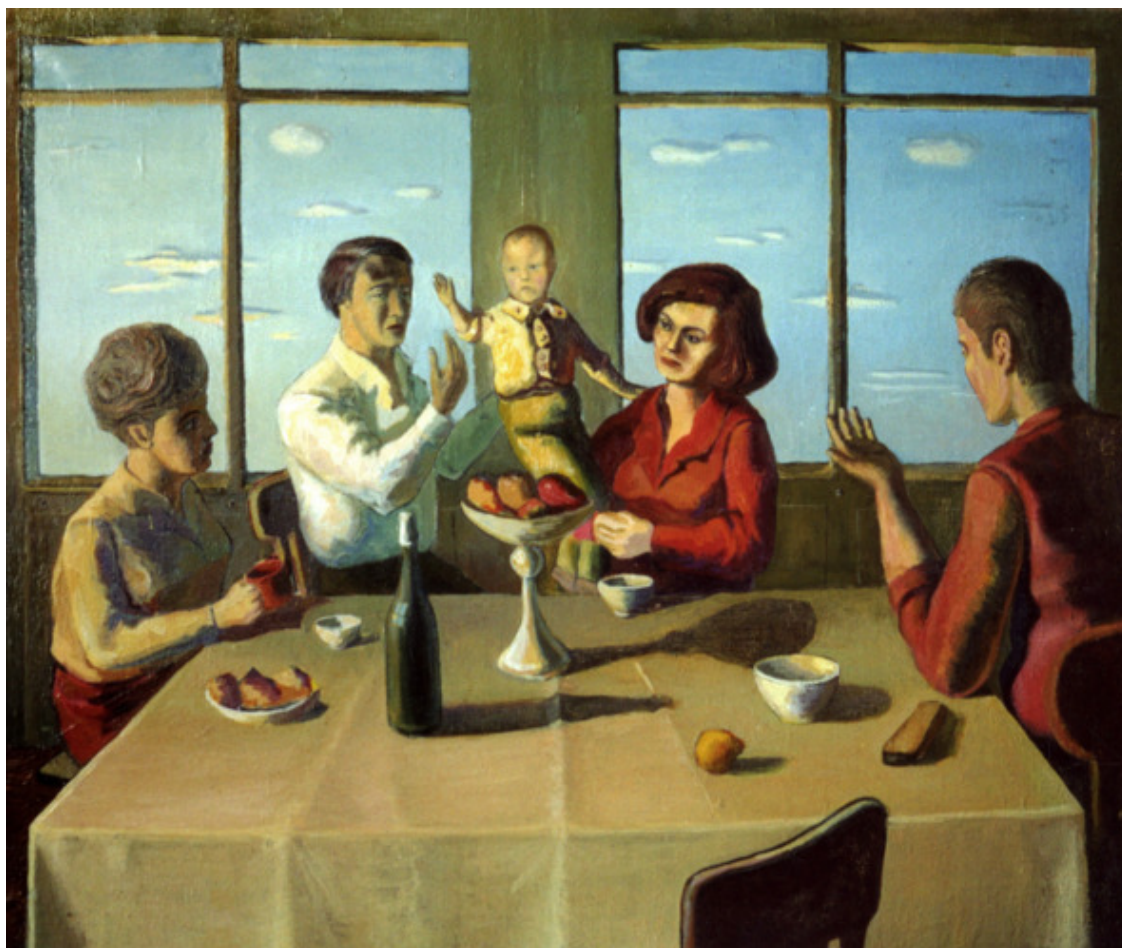
Рисунок 21. А. П. Акиндинов. Ребёнок во времени. 70x83. Масло, холст. 1995.

В истории современной России Алексея Акиндинова по праву можно назвать значимым художником для культуры страны. Для изобразительного искусства интерес представляет не только созданный им стиль – орнаментализм , но и его творчество в целом как художника, как живописца и графика. Свой процесс работы над картиной художник описал так, «словно ленивый и небрежный каменщик я клал кирпичики здания своего искусства. Заранее зная, что здание будет построено и стоять ему долго. Нужно только словно снова прокрутить пленку кино и последовательно уложить каждый кирпичик на свое место. Процесс был мукой. Цель – наслаждением. От других художников меня отличало то, что они писали именно потому, что им это нравилось, и им не нужен был результат – сам процесс доставлял радость. Мне же был нужен результат. Я терпел время, затрачиваемое на создание картины». 82