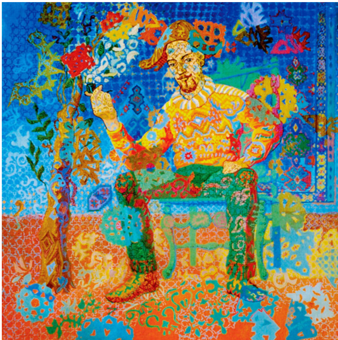
Рисунок 9. А. П. Акиндинов. Юринг-Джай, Юранг-Джанг. 62х62. Масло, холст. 1997.

Ригль подчеркивал не только эмпирическую волю художника, но и делает акцент на его объективную духовную движущую силу, в основе которой лежит «художественная воля», не зависящая от материальных факторов и которая упорядочивает отношение человека к чувственно воспринимаемым явлениям: таким образом, находит выражение стремление человека увидеть форму и цвет предмета.