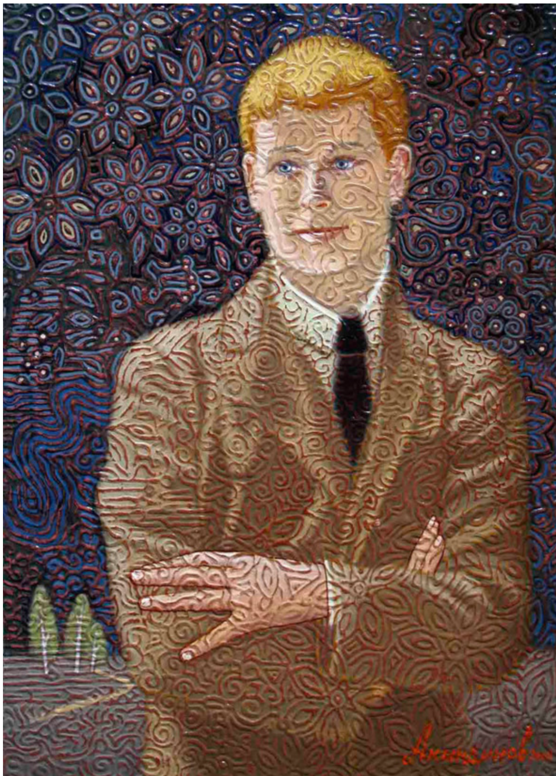
Рисунок 17. А. П. Акиндинов. Есенин. 70x50. Масло, холст. 2008.

Вот яркий пример того, как Гражина Бобилевич анализирует стиль орнаментализм: «Принцип орнаментализации, узорчатости, существенный признак портретирования Акиндинова – получает различную мотивировку и он многофункционален. Орнамент может, как кажется, выражать установку на традиционное понимание функции лица как «зеркала души», так как наложение на личность ассоциативно-смыслового поля орнамента, фокусирующего его коммуникативный потенциал, вкладывает в каждый портрет особенный подтекст. В некоторых