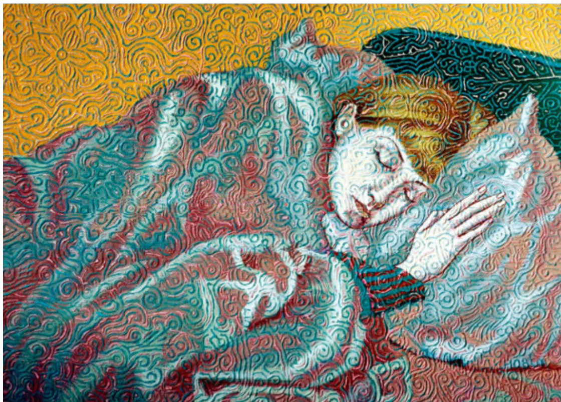
Рисунок 6. А. П. Акиндинов. Нега. Елена. 62x87.5. Масло, холст. 2001.

На рисунке 6 А. П. Акиндинов на примере полотна «Нега. Елена» подробно описал процесс взаимосвязи навыков профессионального академического искусства и стиля орнаментализм, вот как он сам пишет о третьем этапе: «Беру проклеенный холст под масляную живопись и тонирую его тонким слоем масляной краски „кадмий оранжевый тёмный“. Проклейка холста осуществляется несколькими тонкими слоями желатина, с добавлением в него капельки мёда. Мёд является антисептиком и пластификатором. Слой оранжевой масляной краски – грунт холста. После двухгодичной выдержки этого слоя я создаю на этом холсте рельефную орнаментальную поверхность, предварительно обработав его наждачной бумагой и покрыв позже кедровым лаком, это необходимо для лучшего сцепления слоёв масляной живописи. Рельеф создавался масляной краской. В этой картине я использовал эффект дополнительных цветов – зелёноватого и красноватого оттенков. Краска для таких целей практически не разводилась, так как она должна лежать рельефными бороздками» 28 В приложении 2 можно более детально рассмотреть все этапы работы над картинами в стиле орнаментализма у Алексея Акиндинова. Зарождение орнаментализма в России в конце XX века во многом определили роль и место орнамента в современном изобразительном искусстве.