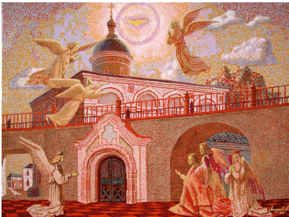
Рисунок 19. А. П. Акиндинов. Альфа и омега. 60x80. Масло, холст. 2002.

Искусствовед предлагает нам довольно подробный анализ творчеству Акиндинова и даёт позитивную оценку орнаментализму. Далее он пишет, что произведения А. П. Акиндинова представляют собой неординарное воплощение творчества «в них органично сосуществуют медитативная созерцательность и практически выверенная концепция художественного решения образных задач. В этом – одна из привлекательных сторон его самобытного искусства». Он призывает всмотреться в персонажи картин художника, которые по его мнению «либо созерцают что-то таинственное, либо ожидают его. Помимо магии орнамента, в них присутствует и магия ожидания. Она заметно чувствуется в картинах «Знамение» (см. рис. 14), «Альфа и Омега» (см. рис. 19), в зимнем оцепенении, запечатленном в «Полуночи». 74