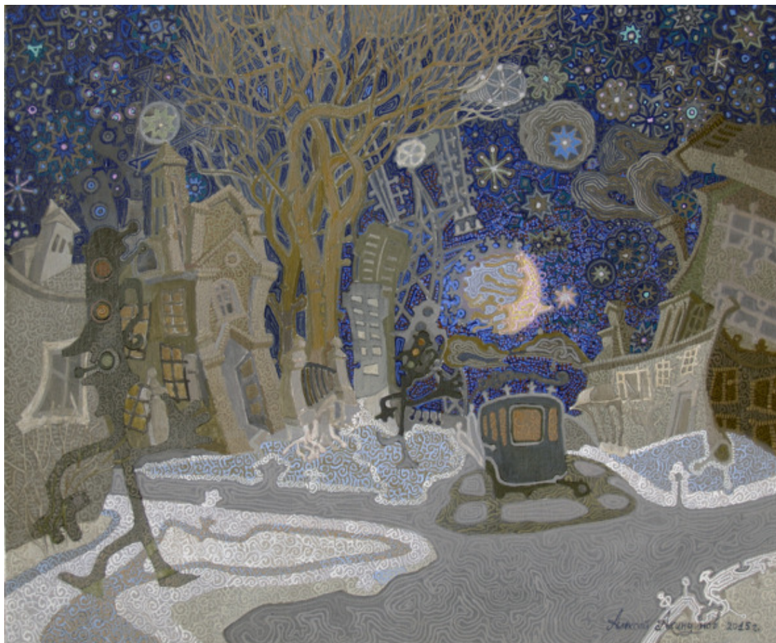
Рисунок 1. А. П. Акиндинов. Танцующий перекрёсток. 47,3x58,5. Масло, холст, акрил. 2015.

Особого внимания заслуживает древнерусский орнамент, который зародился в Древнерусском государстве и стал одним из видов декоративно-прикладного искусства. Его влияние распространилось на Польшу и даже Скандинавию. 15 Среди видов орнамента широкое распространение получил звериный и растительный орнамент, например «топорик Андрея Боголюбского» орнаментирован звериным стилем. Следует заметить, что древнерусские мотивы можно обнаружить во многих работах А. П. Акиндинова. В картине «Андроид и религия» на рисунке 2 отчётливо прослеживаются отголоски традиций древнерусской иконописи и узоры близкие по стилю к орнаментам Киевской Руси.